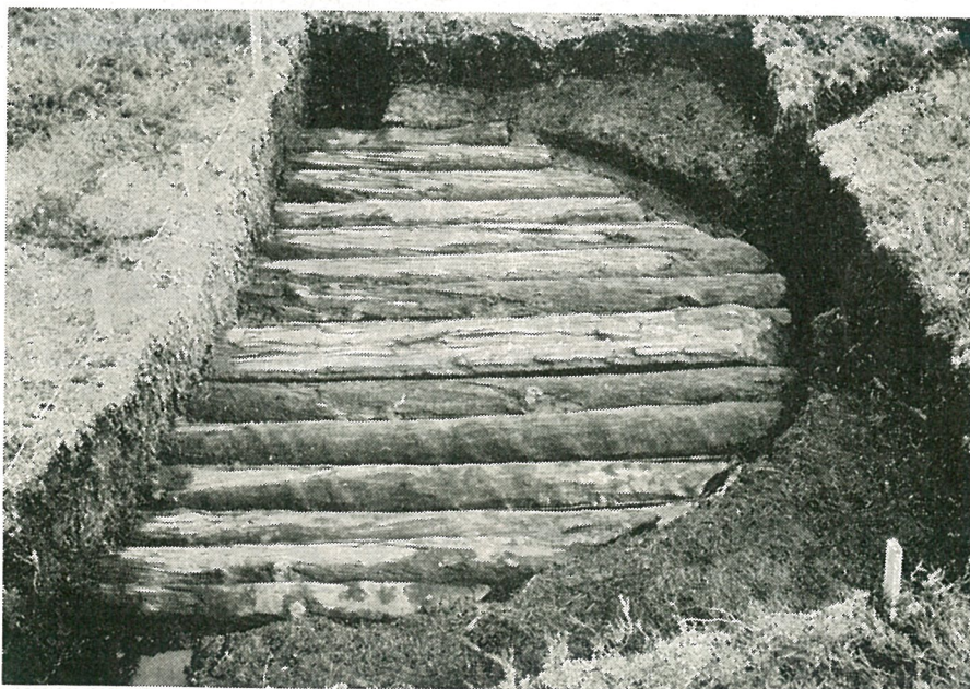
Halvdel av stokkeplatt under utgravning på Raudkjølen på Stavsjøfjellet. Diameter ca. 4 meter.

I tilknytning til plattene, ofte under dem, er det funnet en del redskaper, og det er bemerkelsesverdige hvordan de samme formene går igjen overalt. De viktigste er traug (med hull i bunnen), øsekar, tregafler (laget av kløftede greiner), trespader, et slags rake-redskap med 2½ m langt skaft