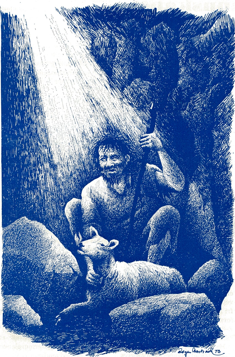
Finnpål i hula, med en stjålen sau.

sørgmodig opp, mumlet noen uforståelige ord med seg selv, og sovnet rolig inn.