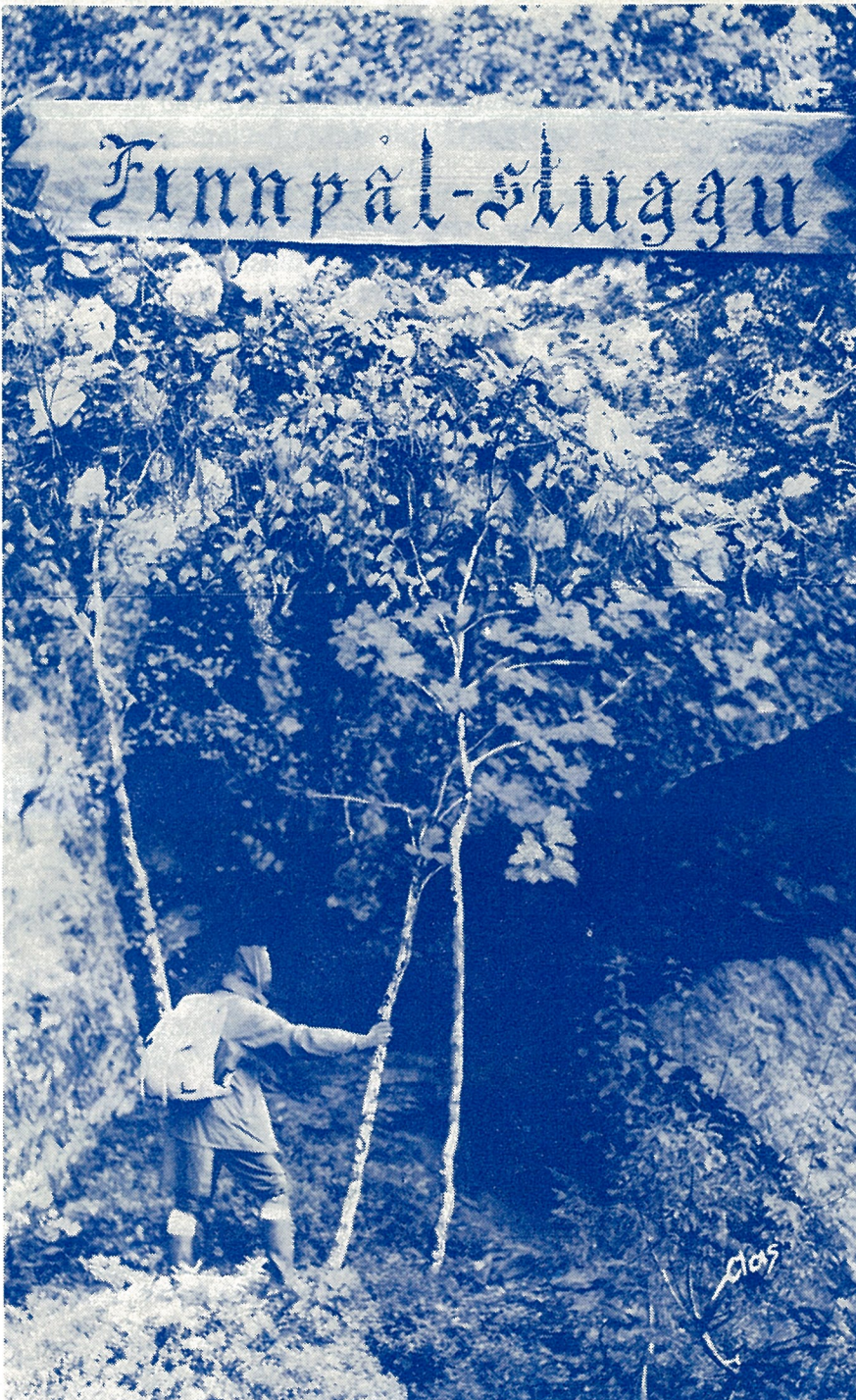
En fjellvandrer skuer inn i «Finnpål-stuggu».

Sent en kveld, mens han drev og dekket en grav med kvister og gras, lyktes det en mann å komme han på skuddhold. Skuddet smalt, og Pål styrtet ned i grava. Da hans banemann kom fram, lå der forhatte villmannen og stirret