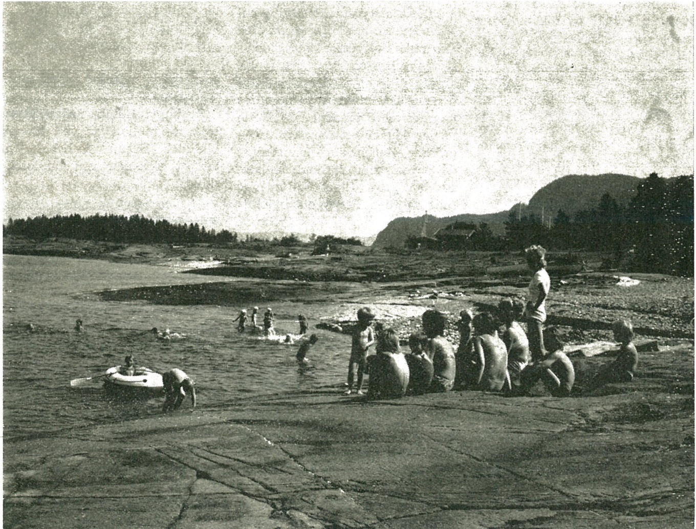
Julidag ved Flatholmen