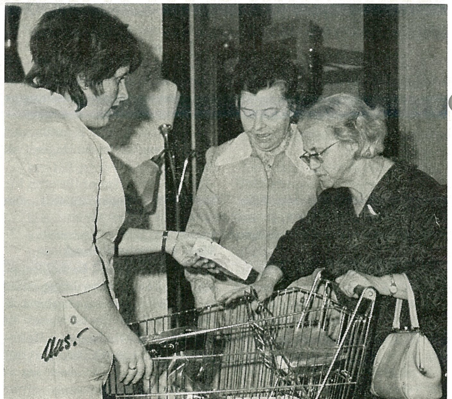
Her frambyr varer fra butikktrallen. For å unngå mulige misforståelser kan vi opplyse at varene selges til innkjøpspris. Ingen business der i gården.

Foreningen har mottatt kr. 500 fra Røde Kors som startkapital. Det er holdt 2 styremøter og 2 gruppemøter. Gruppen har nå 10 pasientvenner som alle er i aktiv tjeneste. Vi har 5 stykker på Aldersheimen i Malvik og 5 stykker på Betania i Malvik.