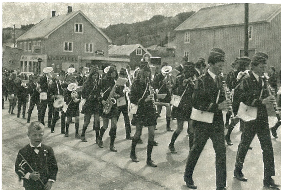
Under full musikk.