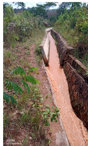
Godt sted at etablere en af de 5 gates til opstemning af vandet.

Han er godt kendt på Heri og værdsat fra sine tre tidligere besøg derude (første gang med etablering af solcelleanlægget).