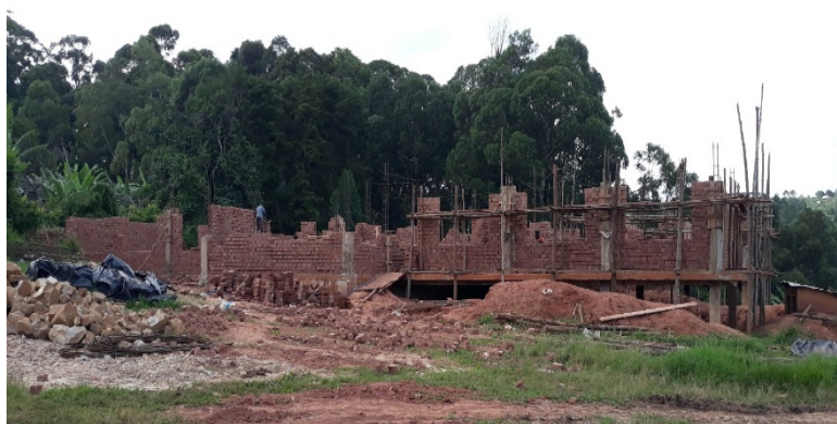
Den nye mandsafdeling under opførelse

Her til slut et billede fra byggeriet af det nye mandeafsnit, som naturligvis også skal have ordentlige toilet og badefaciliteter. Både Murstenene og spærrene til byggeriet laver de også selv.