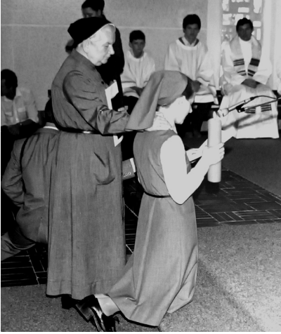
Ikuiset lupaukset 1981