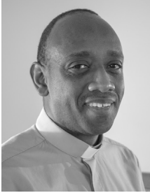
Kuva: Sergio Ocampo