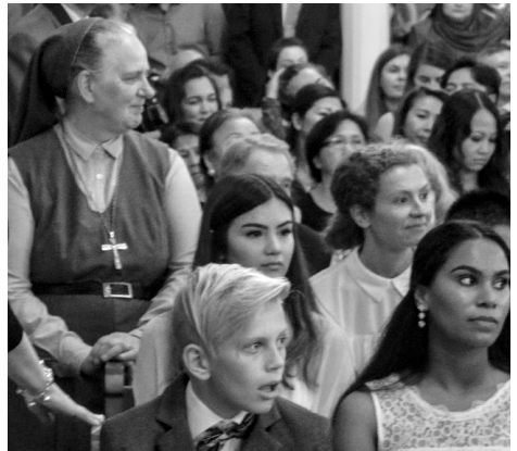
Kuva: Sergio Ocampo