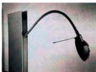
Oskar lampen designet af Ingo Maurer. Fås bl.a. hos light11.dk og belysningskompagniet.dk .