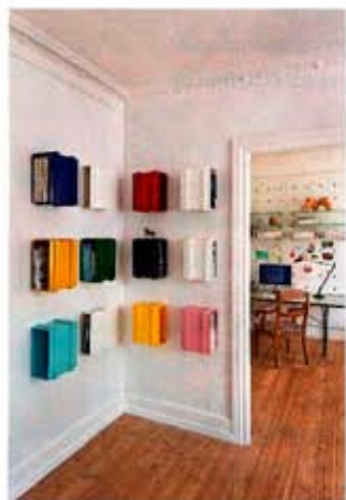
Henriettes seneste bud på møbel-design, Colour Stack, er et praktisk opbevaringsmodul med et dejligt farverigt og personligt udtryk. For nærmere info: henriettewleth.com .