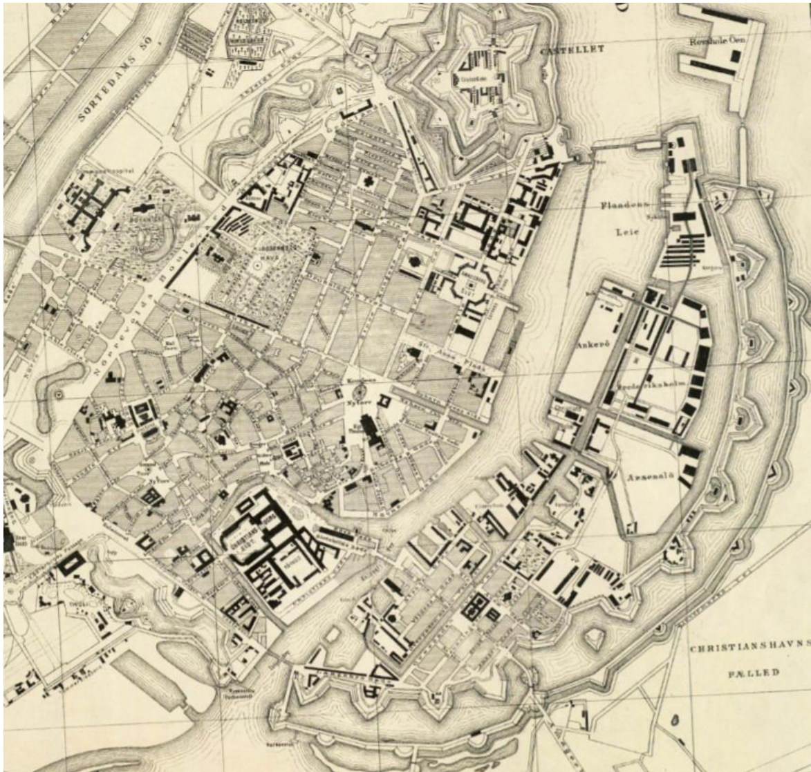
København ca. 1790