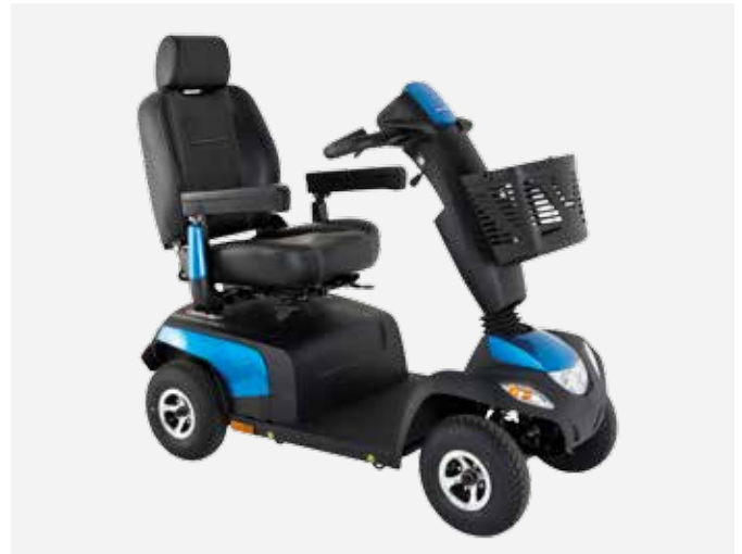
Fyrhjulig Orion PRO