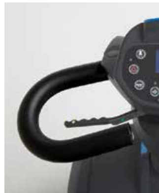
Ergonomiskt utformade handtag

Kan justeras steglöst för att passa individuella behov.