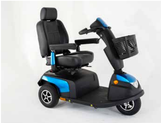
Trehjulig Orion PRO