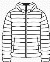
Ligero y Plegable