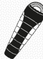
Bolsas de dormir