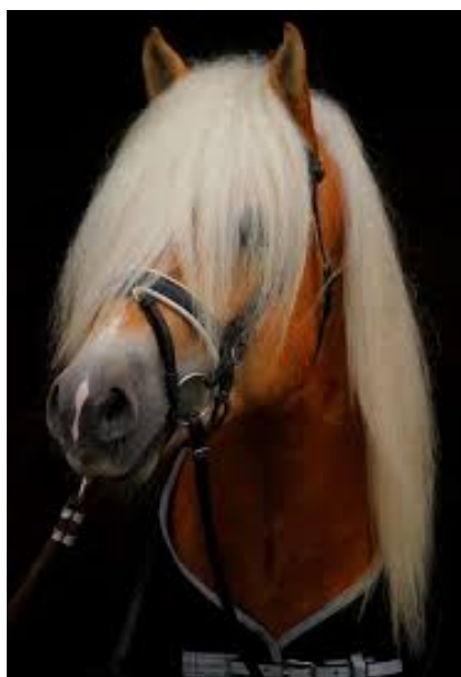
liz.490/DK Stallone af Elghuset