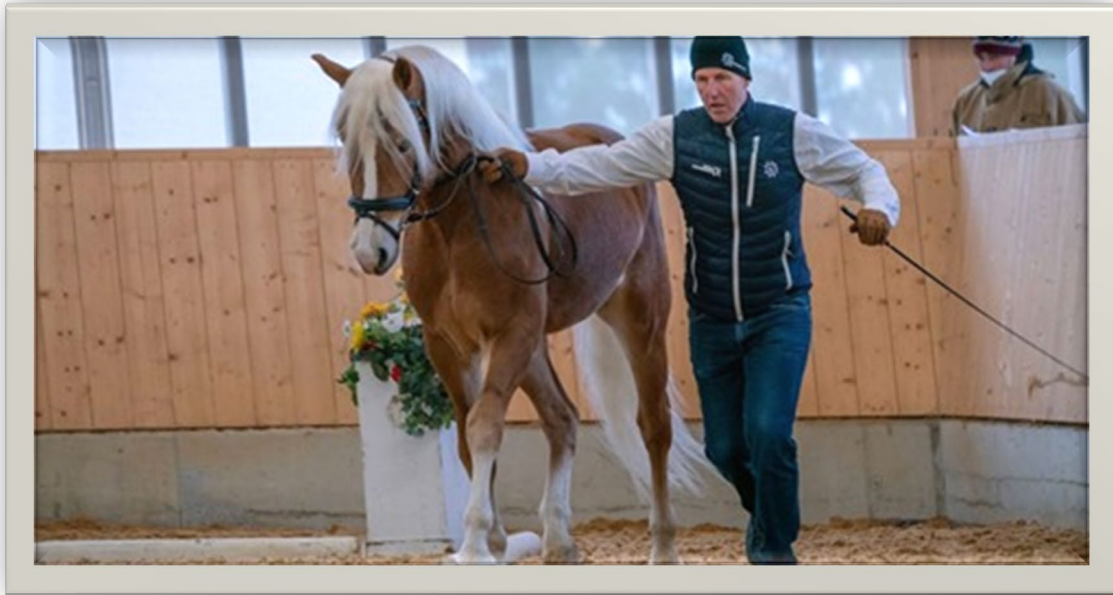
liz. 571 / T Westwind – Kåringsvinder 2021