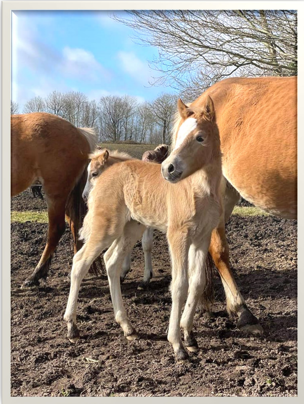
Hoppeføl efter Hala x Iiz. Abendwind