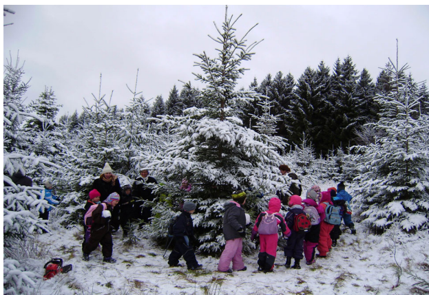
Dans om juletræet.