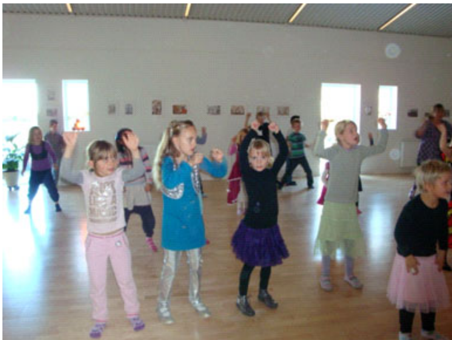
Den 7.11. - Discoopvisning!

Både børn og voksne havde et par hyggelige og sjove timer, hvor børnene var aktive, og viste hvor dygtige de var til at danse.