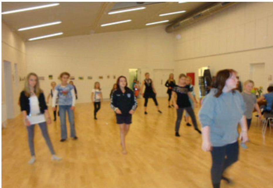
Den. 5.11. - Hip hop i festsalen.