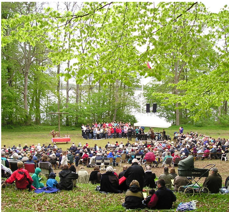
Friluftsgudstjeneste 2. Pinsedag den 12. maj 2008 kl. 10.30 i Vedbygaards Park. Se nærmere inde i bladet.