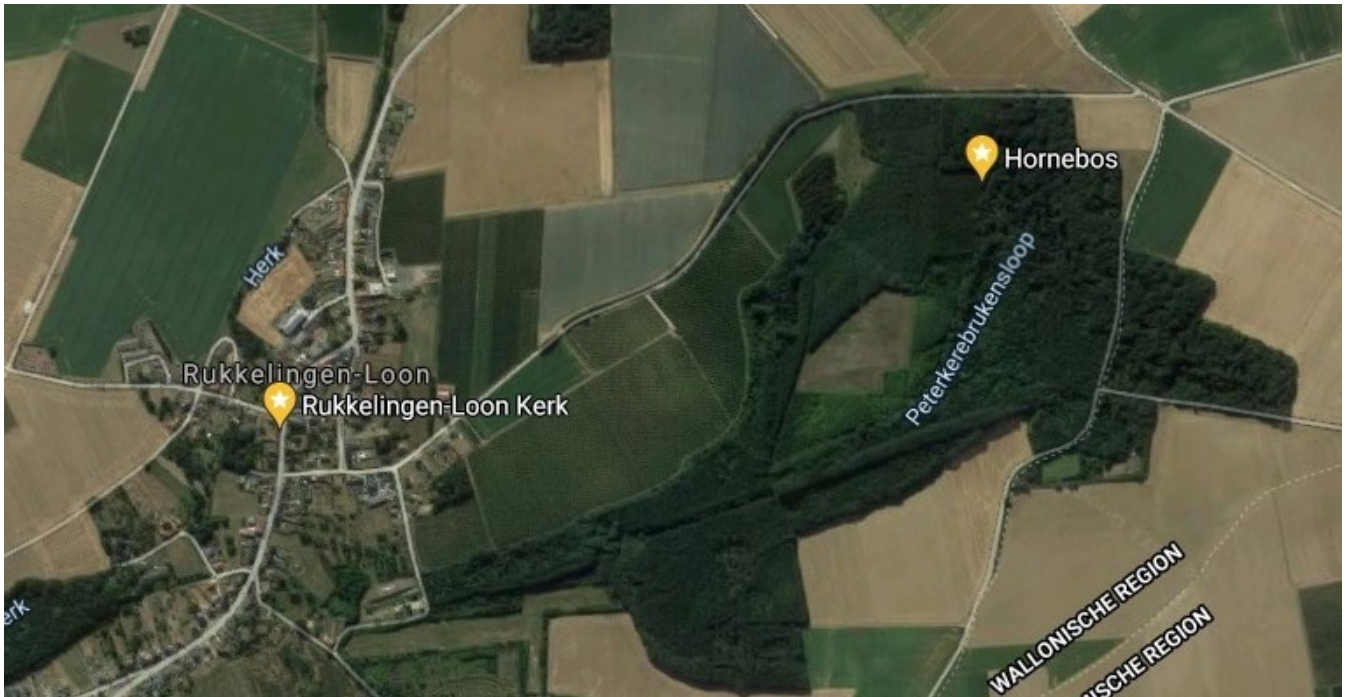
Rukkelingen-Loon, satellietbeelden, geraadpleegd op 22 april 2021 . Bij vergelijking met de zeventiende-eeuwse kaart valt de continuïteit qua bebouwing, wegennet en het natuurlijke landschap op.