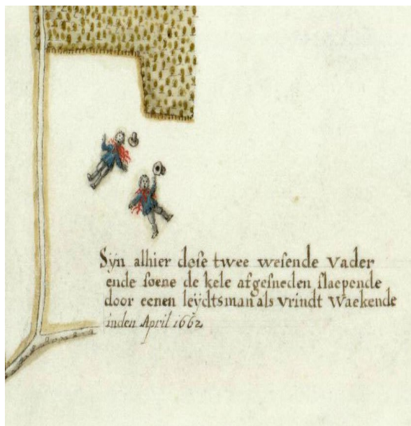
De dubbele moord in Rukkelingen in april 1662, zoals afgebeeld in het kaartboek van de Abdij van Averbode