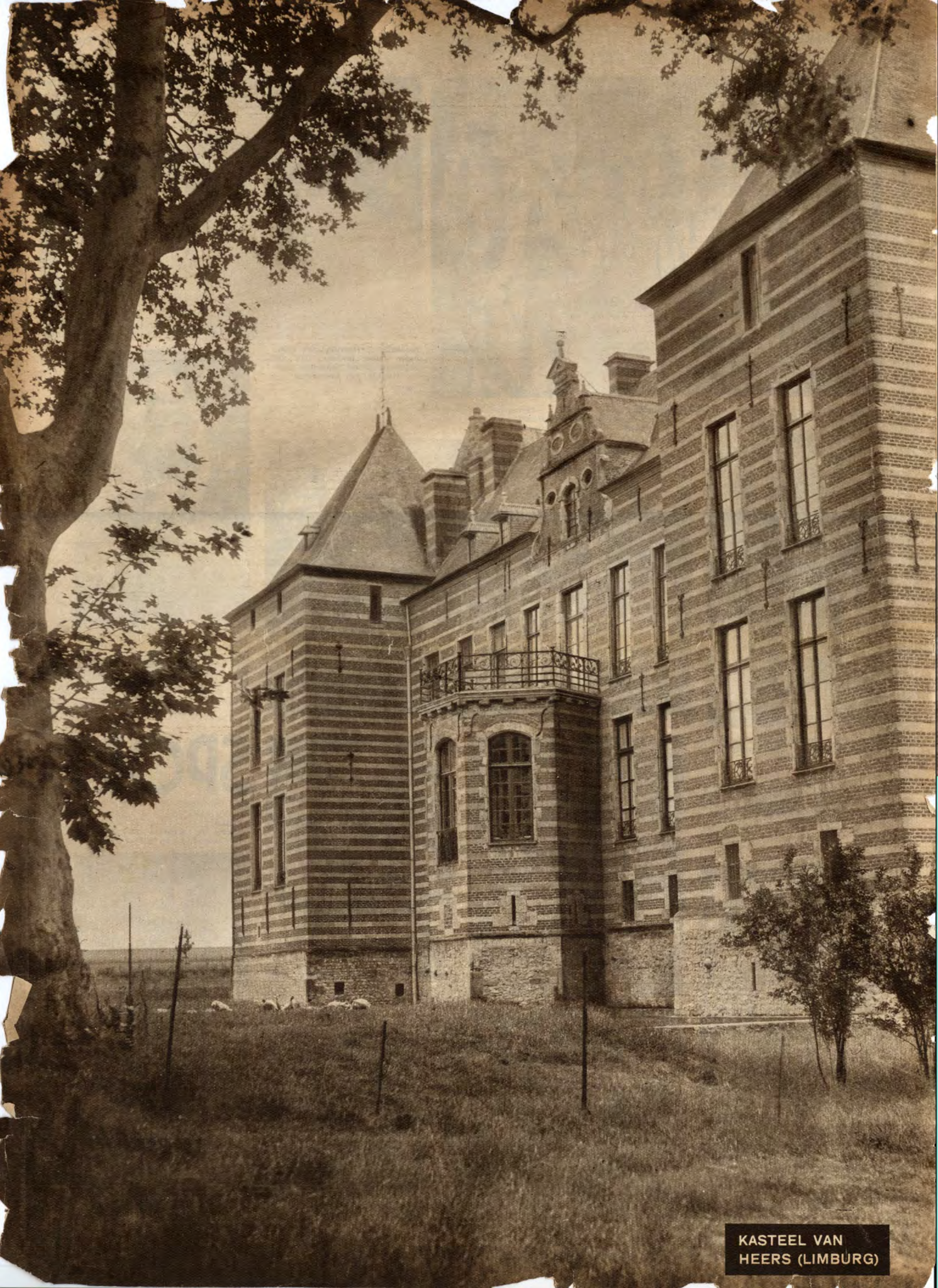
KASTEEL VAN HEERS (LIMBURG)