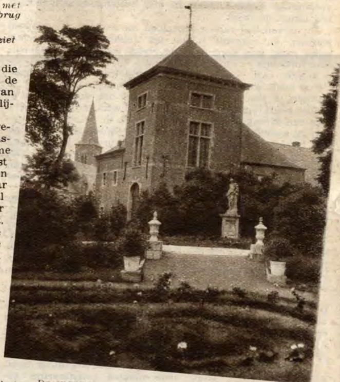
De ingang der Sint Galls-hoeve met vierkanten toren.