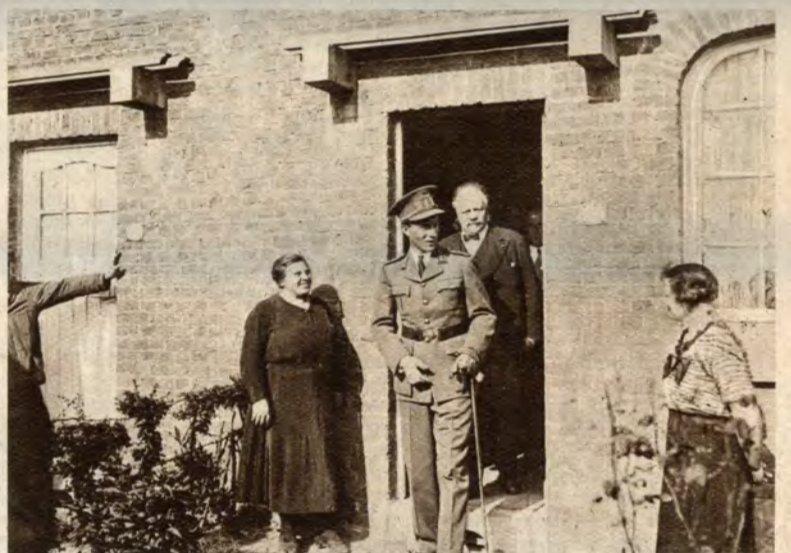
Koning Leopold III bezoekt de nijverheidsstreek Luik-Seraing. Hij verlaat een werkmanshuis.