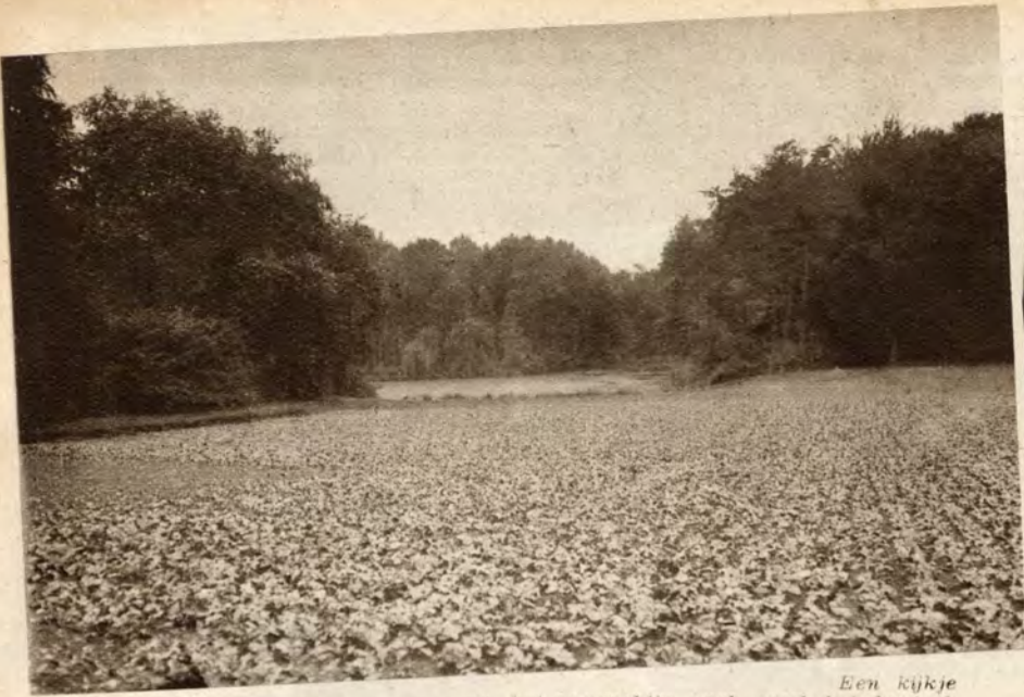
Een kijkje op het reusachtig park rond het kasteel.