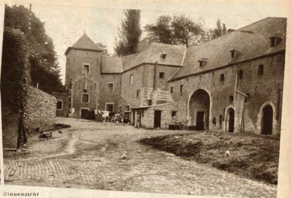
Binnenzicht der typische St. Gillishoeve.

onderging maar waarvan de muren toch bleven rechtstaan.