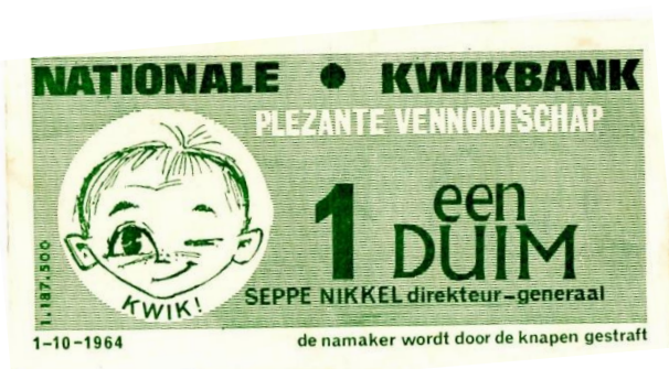
Chiro papiergeld 1964