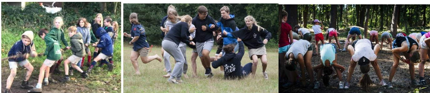
Allerhande spelletjes, alsook trektochten en nachtspel