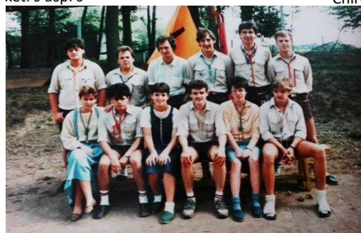
Chiroleiding Eduka 20 jaar Neerglabbeek