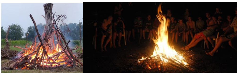
Laatste avond : kampvuur : spelletjes, sketches, zang en avondafsluiting