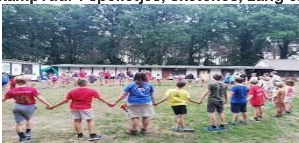
Afscheid : laatste bivakformatie voor de afreis