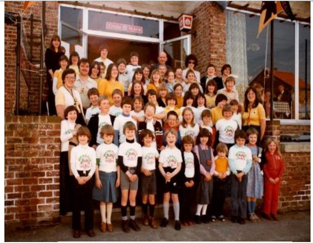
Chiro Eduka Heers 15j speelclub rakwi's