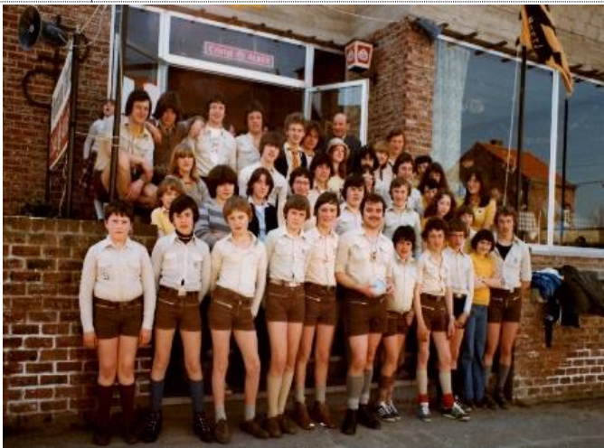
Chiro Eduka Heers 15j toti's keti's aspi's