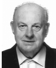
Jacquelin Carlens Busvervoer

Vanaf toen (Dohan) werden het ‘gemengde’ kampen, weliswaar in gescheiden tenten of gebouwen op het domein zelf.