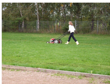
Der slås græs på legeplads.

Der er udført mindre reparationer af legeborgen og der er blevet slået græs, fjernet ukrudt og trimmet hække. Legepladsen trænger til fornyelse, så vi har indhentet tilbud på en såkaldt gratis legeplads, den var desværre slet ikke gratis, så det var ikke interessant i denne omgang. Vi håber mange får glæde af legepladsen igen i år, og at vi bliver forskånet for hærværk.