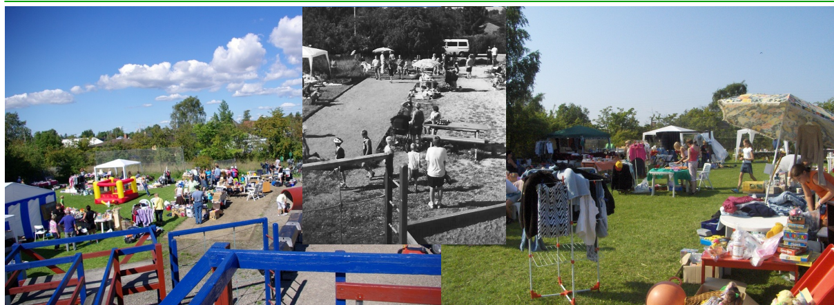
Fotos fra Grønnehaves loppemarkeder for 10, 13 og 20 år siden

Loppemarked på legepladsen søndag d. 26. august kl. 10 — 16