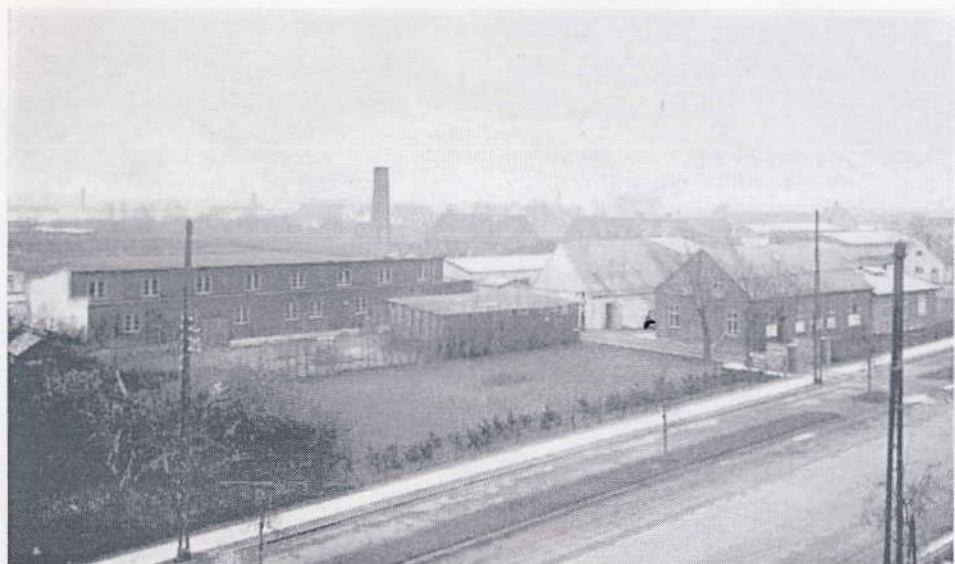
A. Hede og Co., Amager Landevej 87. Foto ca 1947.

Medicinalfabrikken A. Heede blev opført i midten af 1940'erne på Amager Landevej 77-85 ( den tomme grund ved politistationen/hovedbiblioteket ) og tilsyneladende videreført af Frederiksbergs Kemiske Fabrik i 1955. Der var dels en møllebygning, hvor råstofferne til medicinen blev malet og blandet, desuden laboratoriebygninger til analyser samt andre bygninger til opbevaring af tabletter, værksted og kontorer. Fabrikken ophørte i 1970'erne. I dag ligger grunden brak, efter at den er blevet oprenset i 1980'erne.