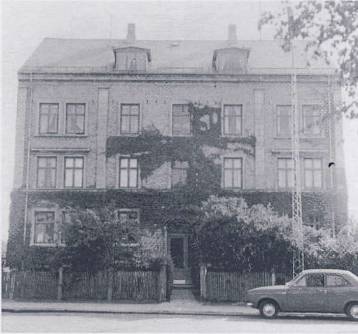
"Tilfredshed" på Nordmarksvej 71 i Kastrup, I slutningen af 1800'tallet blev nogle af lokalerne i huset desuden brugt til børnesanatorie, deraf navnet.

Grundejerne var først og fremmest håndværkere og arbejdere. Grundejerforeningens første veje, der blev anlagt var Borgbygårdsvej, Tårnbyhøj Alle og Ved Gærdet. Medlemmerne af grundejerforeningen klagede over kommunens manglende hjælp til kloakering, veje og gasforsyning.