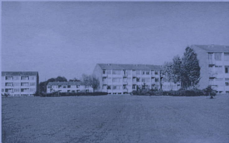
Lufthavnsparken i Kastrup, et boligbyggeri med ca. 500 lejligheder bygget i 1950-51.

mursten højt tegltag og med små altaner.