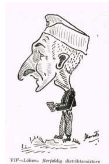
VIF-»Löhens» flerfaldig distriktsmästare