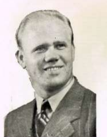
»Kina» — hedersordförande