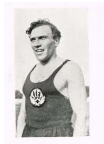
Allan Henson rekordhållare på 400 och 800 meter.