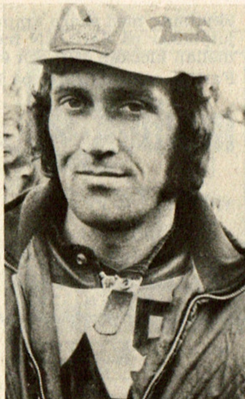
□ Så här ser 1976 års svenske mästare i speedway ut, Anders Michanek.