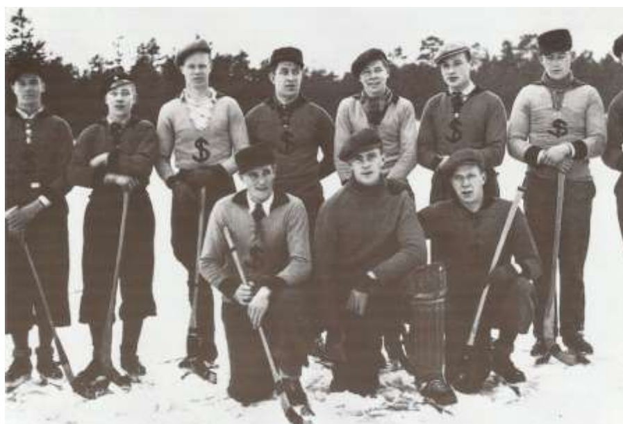
Slite IF:s bandylag i mitten av 1930-talet