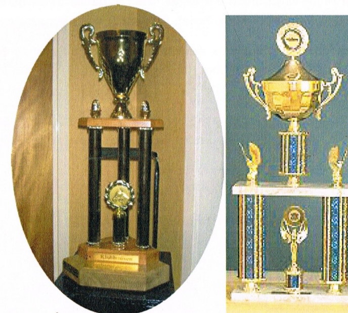
Klubbmixen pokal och Mulde World Cup pokal

Vi insåg efter några år att vi borde införskaffa några stora pokaler till vandringspris.