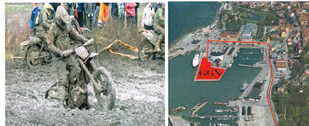
Gotland Grand National Parkering Holmen en viktig bit som ger oss det lilla extra inkomsten till Mulde VK.

Gotland Grand National med parkering på Holmen gav ett resultat på 6000:-