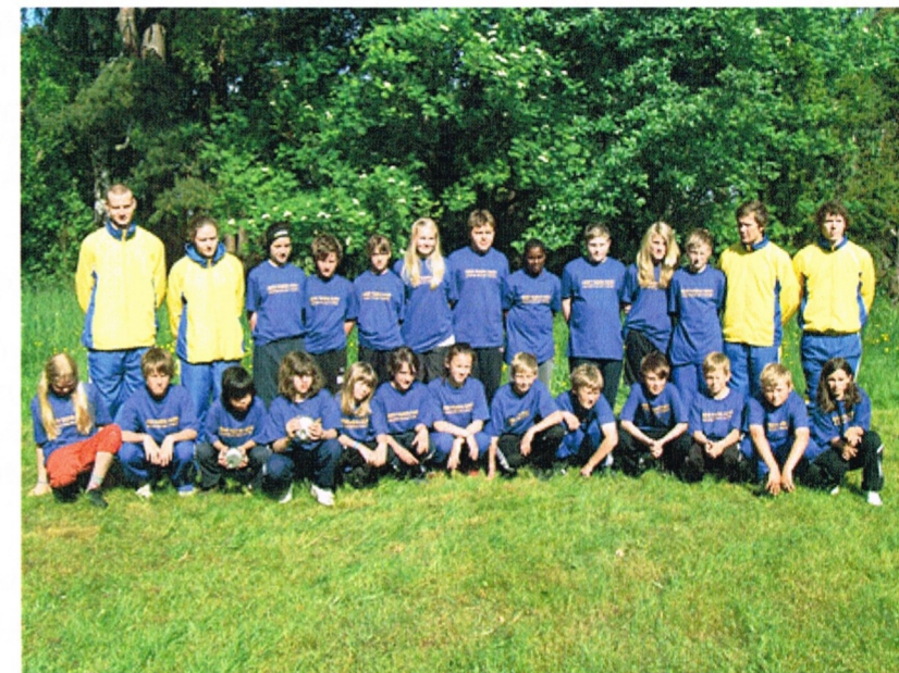
Mini Varpa Camp Gustavs Fröjel 2010.