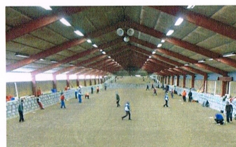
Här började allt. Mulde ridhus