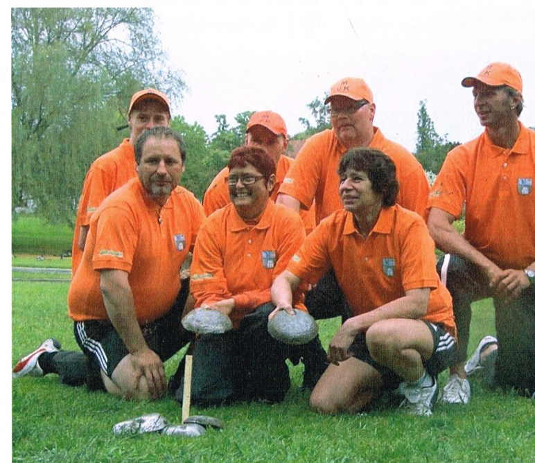
Presskonferens Aftonbladet Almedalen.

I början av juni så var Aftonbladet vid oss och gjorde ett reportage. Vi hade fått ett antal tusenlappar till nya klubbtröjor med "Sportmiljonen" som sponsor som var ett av Aftonbladets projekt. Träffen var vid Almedalen och där skulle det fotograferas och kastas varpa. Vädret var inte det bästa, det regnade, men vi kastade med glada miner, och Aftonbladet fick sina bilder och vi fick våra fina tröjor.