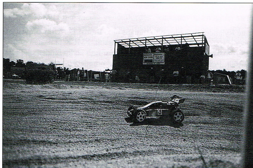
GMF:s senaste tillskott i klubbverksamheten - miniracing. En egen bana finns vid Skogsholm.