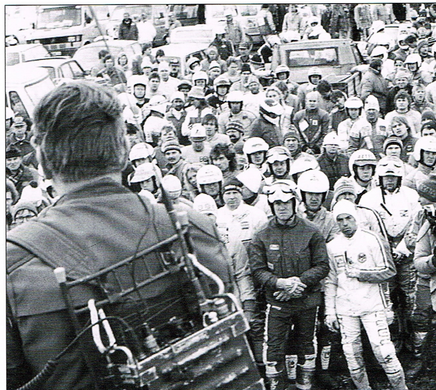
Åksugna GGN-förare får information i depån före starten. År 1994 startade nära 1 900 förare.

GGN gav upphov till samarbetet inom Idrottens Ö och är ojämförligt det största arrangemanget.