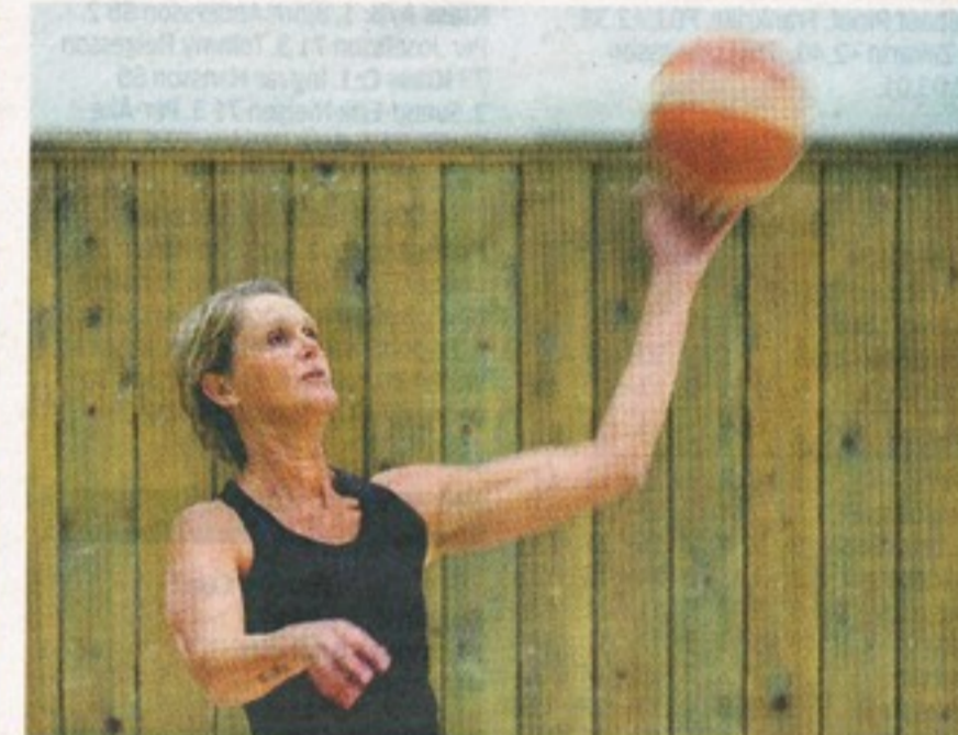
LOTTA. Ladies-veteranen spelade i damligan till 2014.