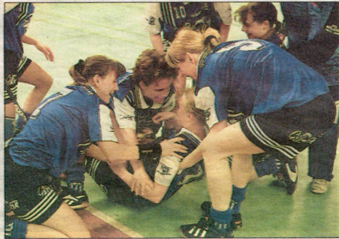
Segerglädje. Tjejerna i H/H var överlyckliga när matchen var slut.