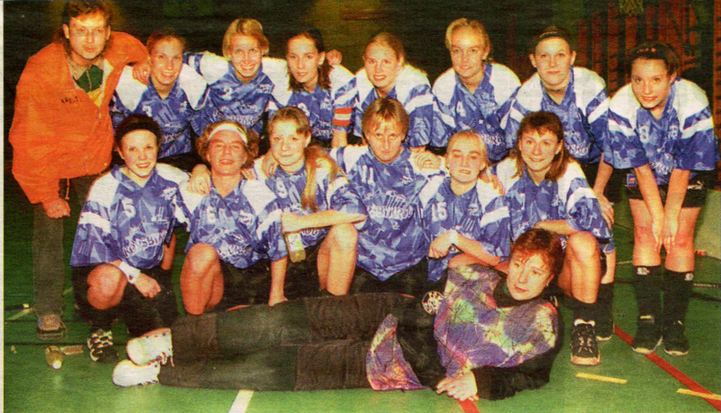
SUDRETS STOLTHET Hansa/Hoburgs damer säkrade seriesegern i damernas division II-serie genom att i Hemse besegra Wisborgs med 7-0 i lördags. Då blir man så här glad.