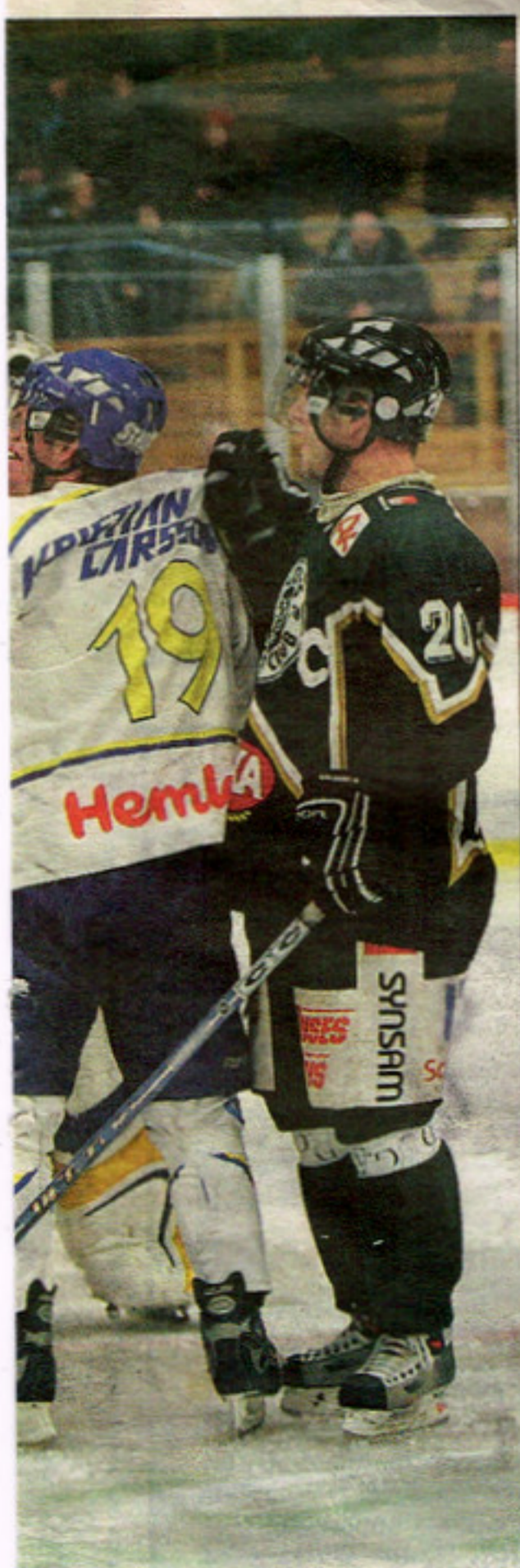
ort slagsmål med fyra matchstraff.