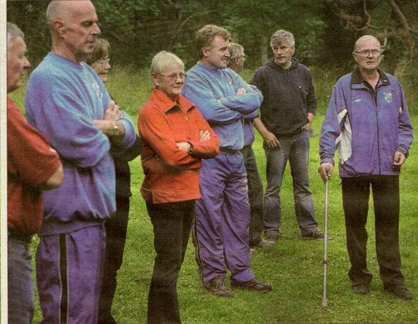
Gemenskap. Samvaron och de gotländska lekarna var viktigast när Wisby bollklubb firade i Åhsbergsga hagen i onsdags.