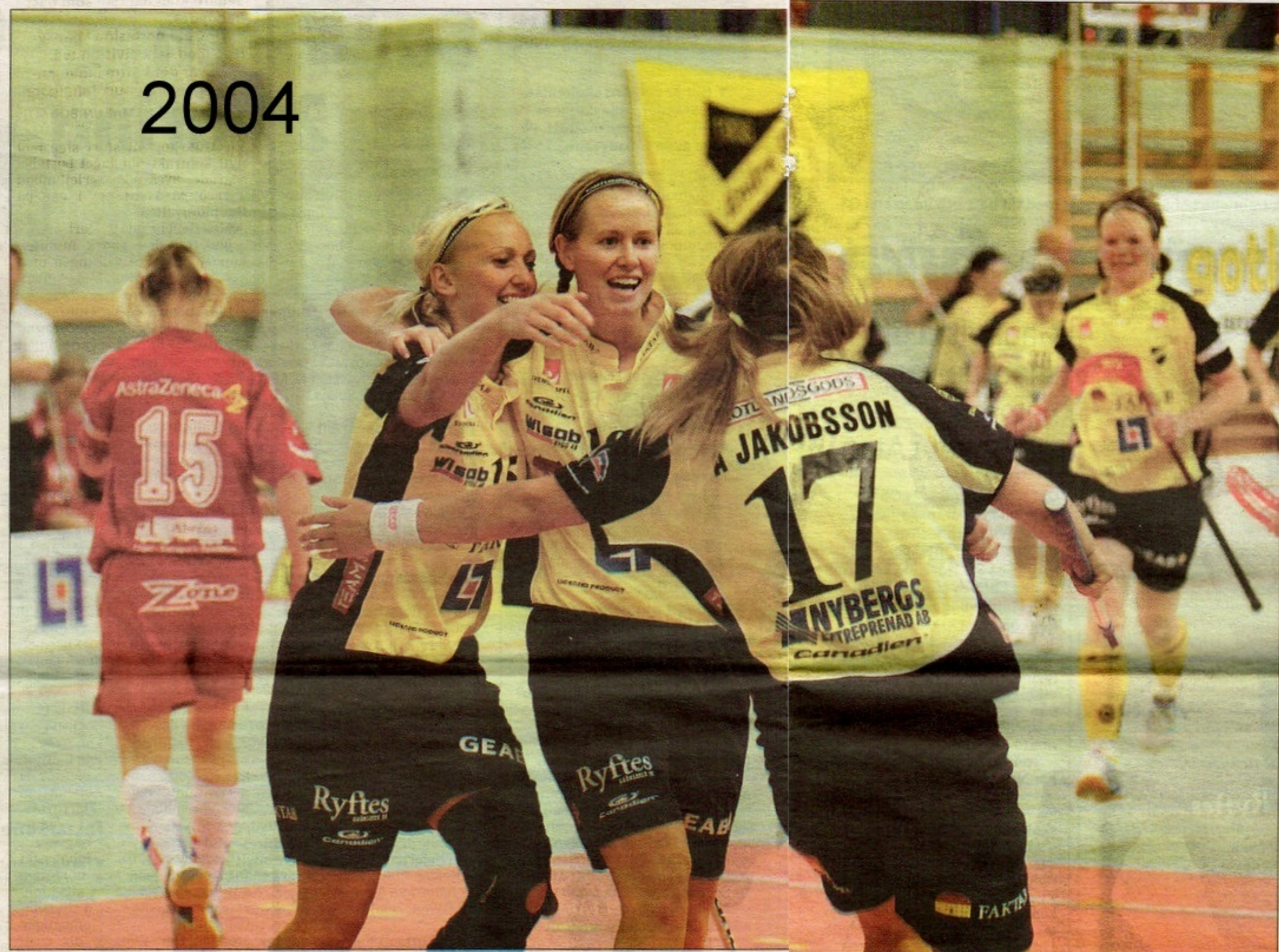
Segerjubel. Det blev en klang- och jubelföreställning i Södervärnshallen när nykomlingen Endre tog emot förra säsongens SM-tvåa Södertälje i elitseriepremiären.