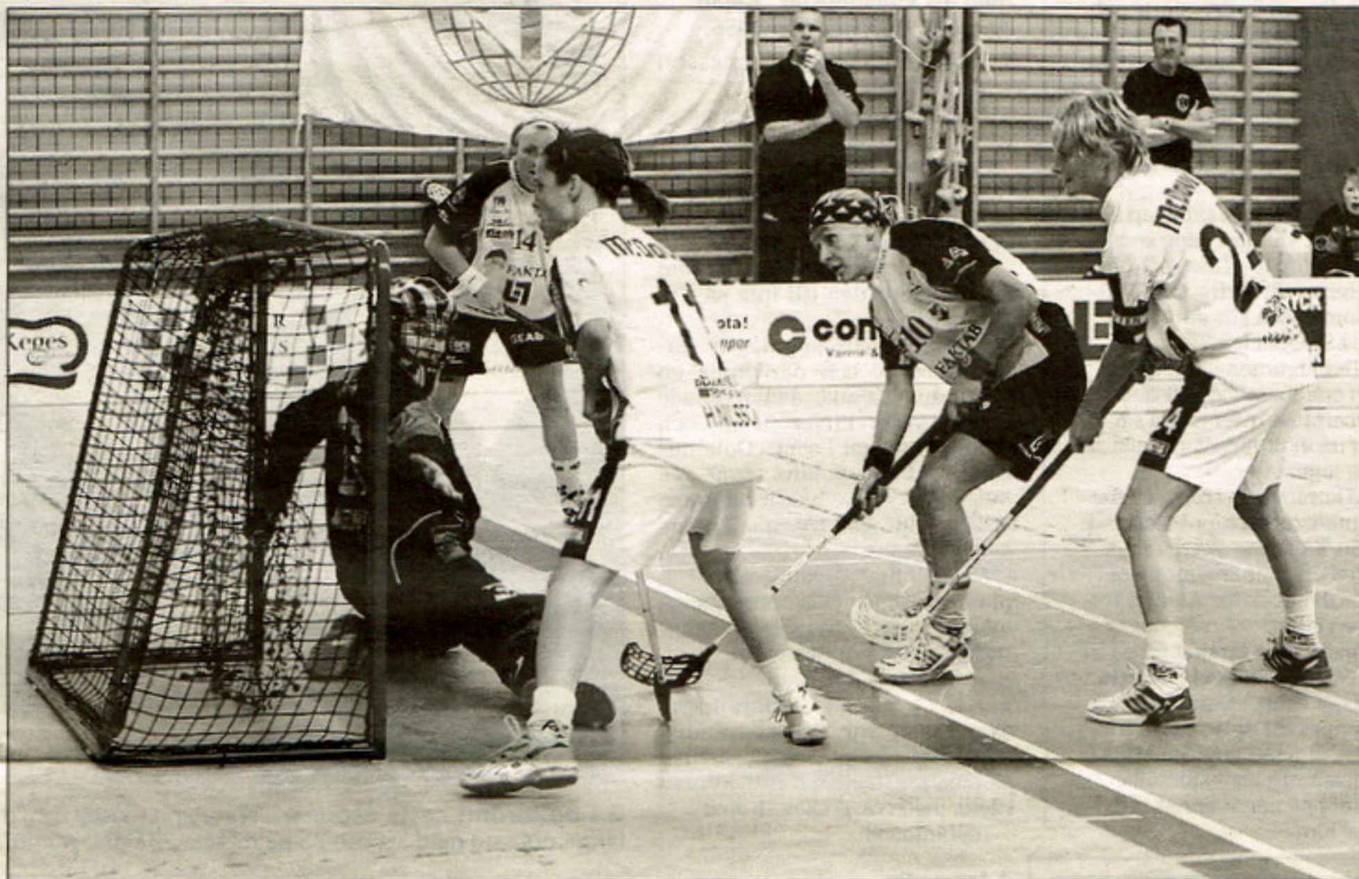
Dubbelt. Det blir en tuff helg för Endres tjejer med match både på lördag och söndag.

Ladies har dock en hel del att jobba på, såväl försvars- som anfallsmässigt.