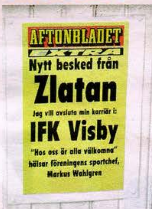
Zlatan! Vid IFK Visbys klubbkiosk i Västerhejde handlar mycket om Zlatan Ibrahimovic. Fyndigt!

Z latan-löpsedel på IFK Visbys klubbkiosk fångade många nyfikenhet och intresse. Det stod: "Jag vill avsluta min karriär i IFK Visby..."