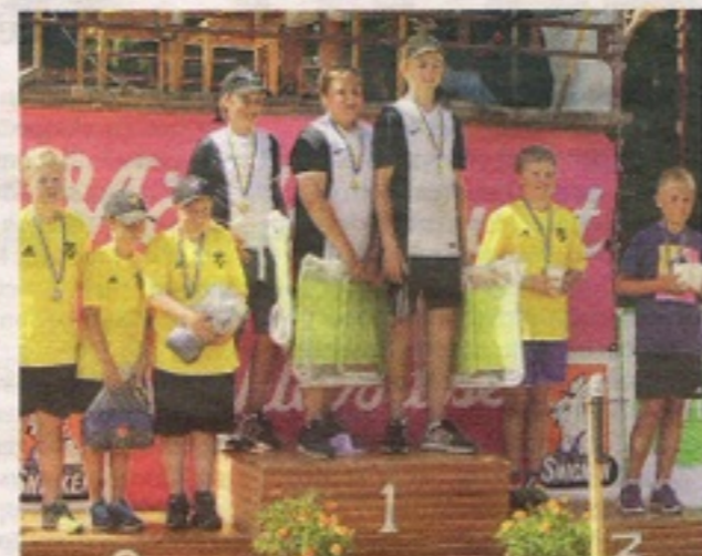
På prispallen. Varpa-SM i Eksta 2017.