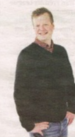
KOMMENTAR Linus Ehn

Gotland kan inte bara vara sommaröppna stenugnsbagerier för stockholm mediaelit på semester. När varpa-SM i Eksta summerats hoppas jag på en ny vår för sporten. En annan utveckling vore oerhört vemodigt att behöva se.