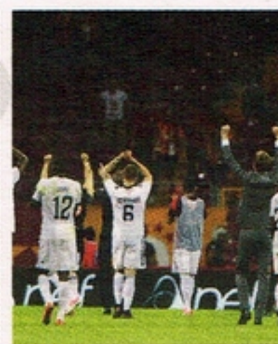
Jämtländskt segerjubel i Turkiet.