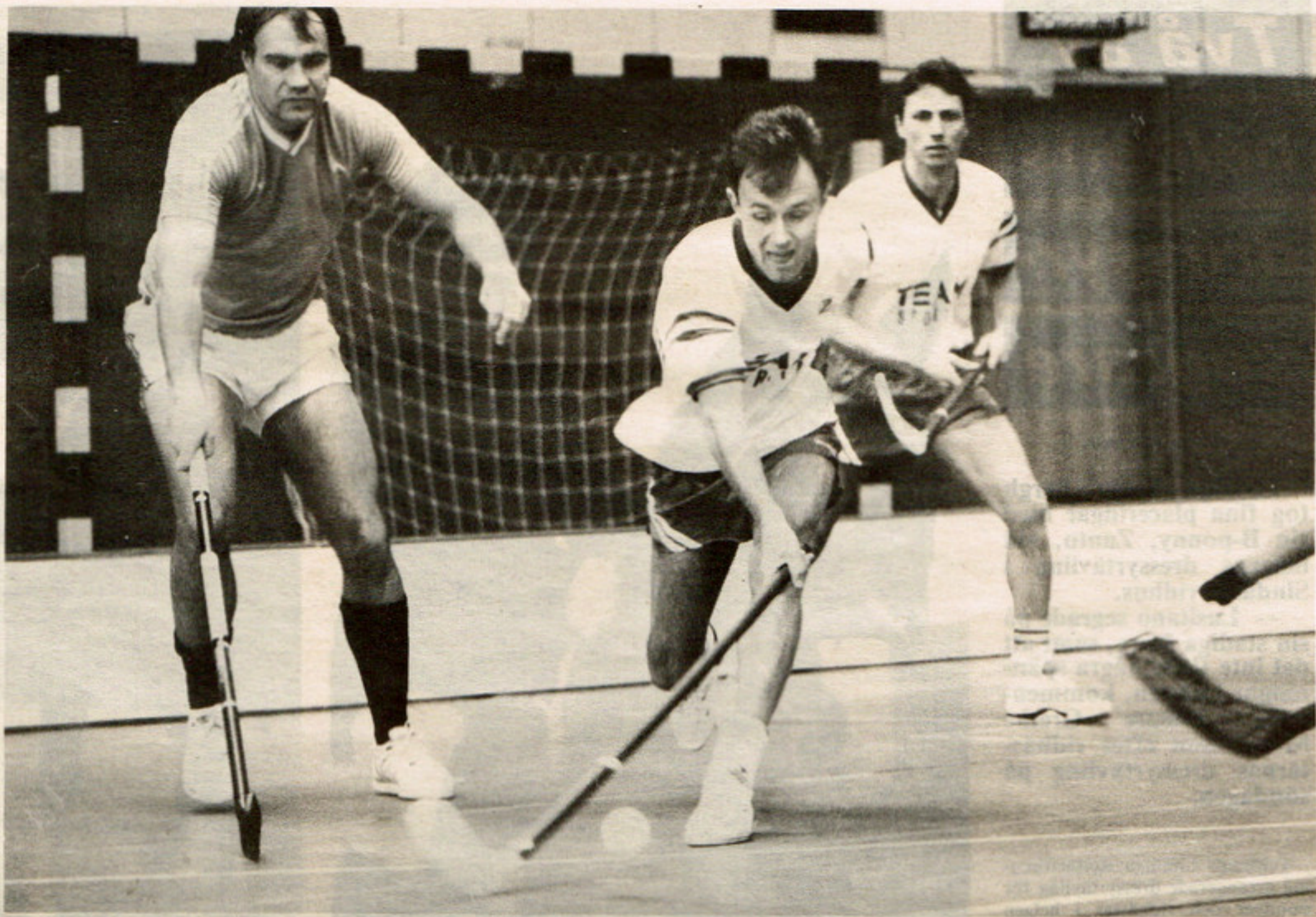
□ RÄDDNINGSTJÄNSTEN har just brutit ett Ericsson-anfall och sätter fart mot motståndarburen. Men det gick nu inte så bra, stryk med 5-12.

— Det spelades också mycket bra innebandy i norrtean, inte minst matchen mellan Othem och Lärbro (2-1) som var riktigt bra med bollskickliga spelare, säger Bengt Boström.