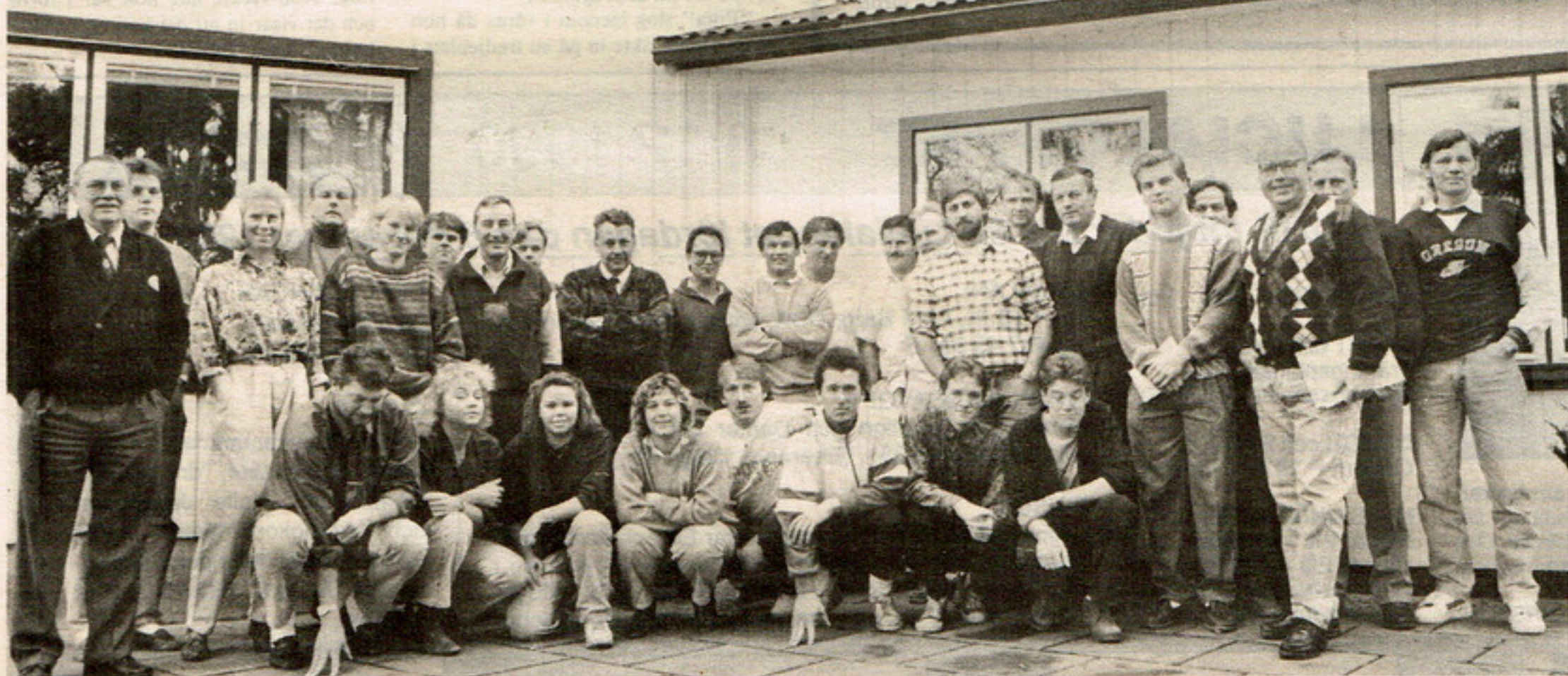
□ Ett 50-tal gotländska fotbollsdomare träffades på Toftagården i lördags för att diskutera såväl den gångna säsongen som den kommande. (Foto: Sören Andersson).

Totalt har 55 gotländska domare dömt fotboll under 1990.