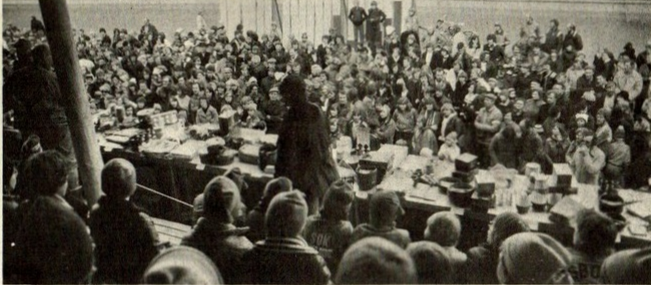
□ DEN HÄR BILDEN bevisar klart och tydligt att det var mycket folk vid årets Korpen. Bilden tagen vid prisutdelningen.