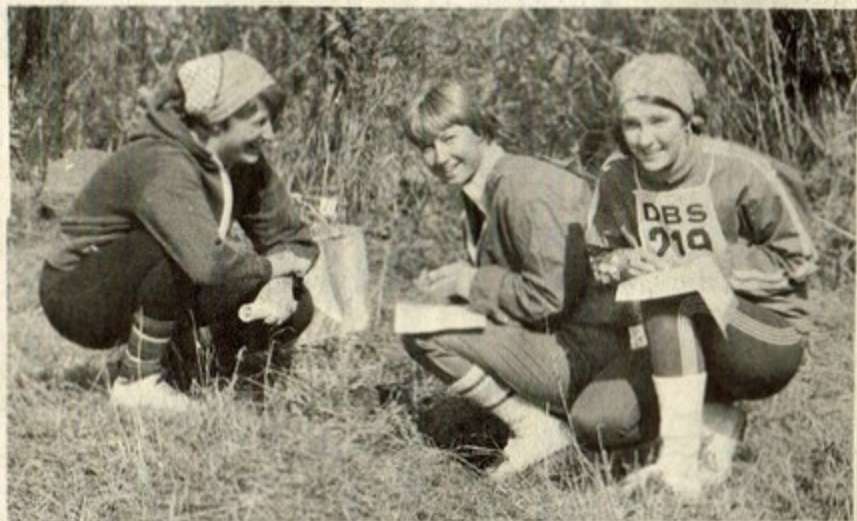
□ LAG NR 219, "Tut tut akut", stämplar vid en kontroll. Tre glada tjejer som hade mycket kul med Korpen i orientering.