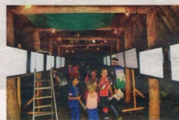
NYTT MÖTER GAMMALT. I långhuset med anor från järnåldern kunde deltagarna se resultaten på digitala skärmar.