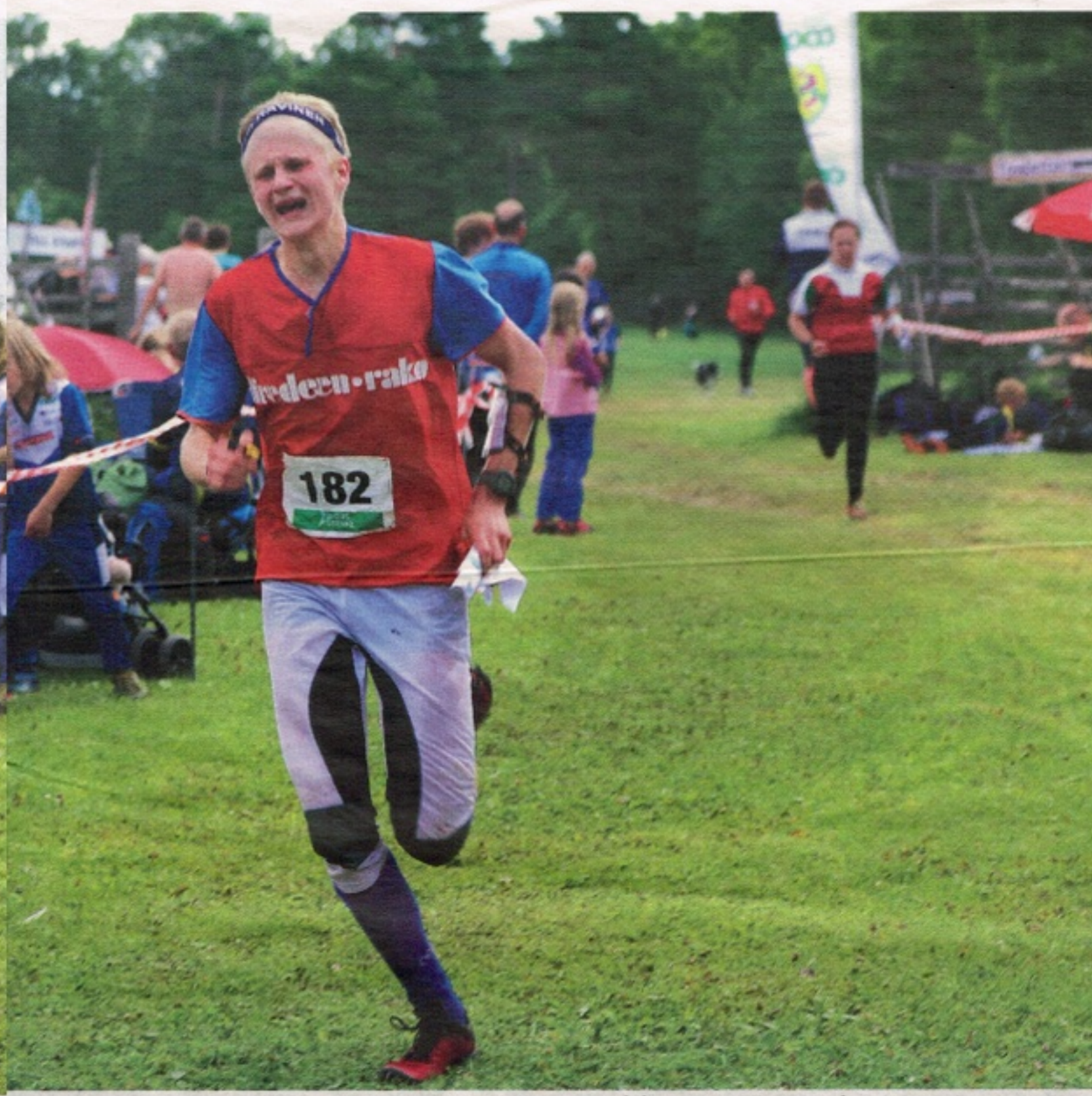
” Jag ser verkligen fram mot tredagars nu. Det blir tuff konkurrens, men jag ska kötta på så bra som möjligt. Jag siktar på att vara med i vinststriden”, säger