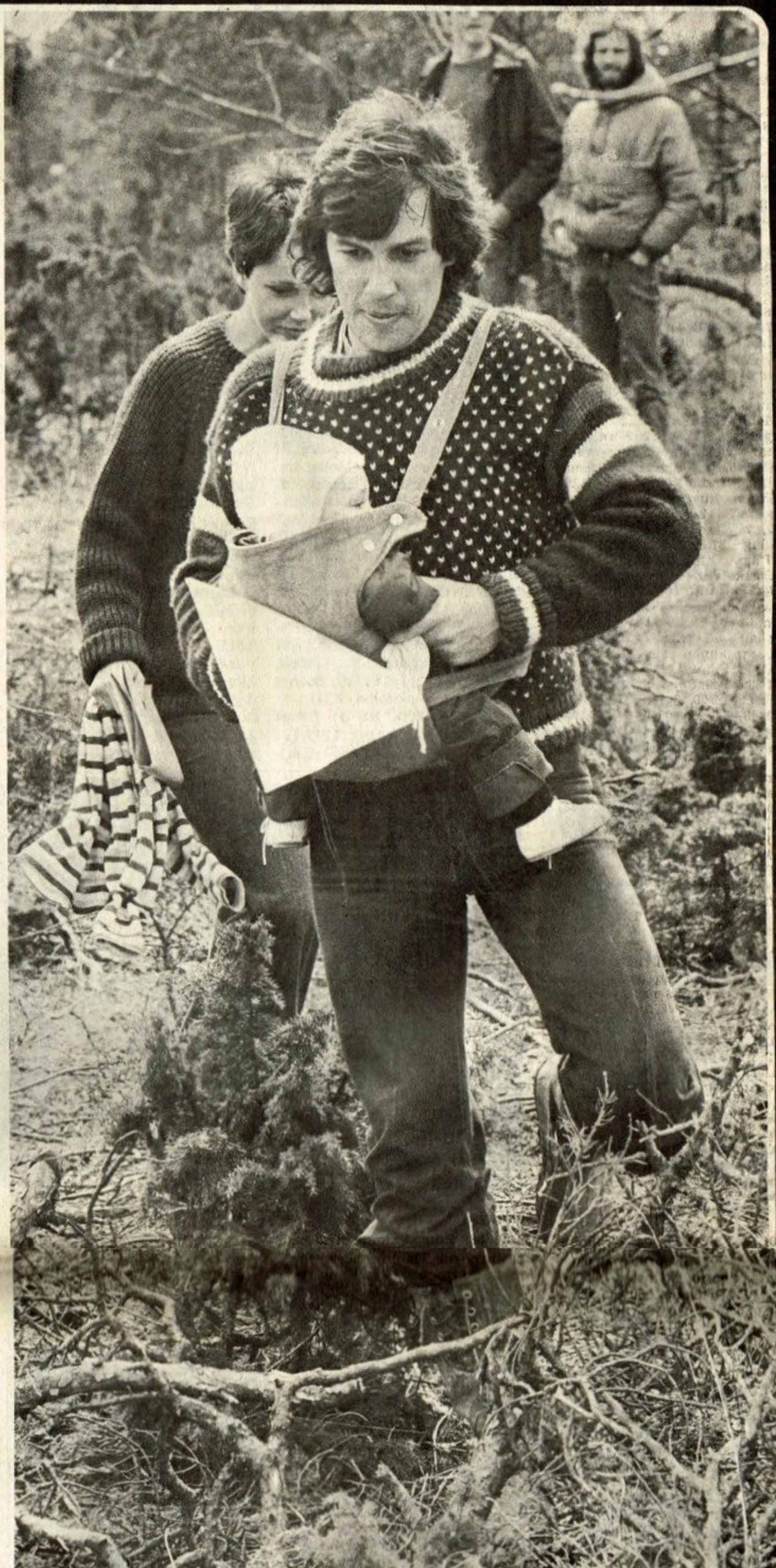
□ HÄR ETT LAG utan någon synlig nummerlapp. Men vi vågar ändå påstå att den lilla baby'n — 6 månader — lär vara den yngste deltagaren i årets korpenorientering.

Så nu vet "Bison" att han inte är oumbärlig... Men visst hade både publiken och GA-läsarna gärna sett "Bison" springa, därefter skriva roligt, i vanlig ordning, om folkfesten vid Skrubbs.