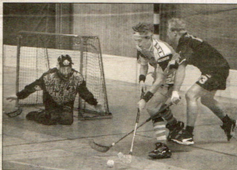
Follingbo Flyers med mål i sikte.