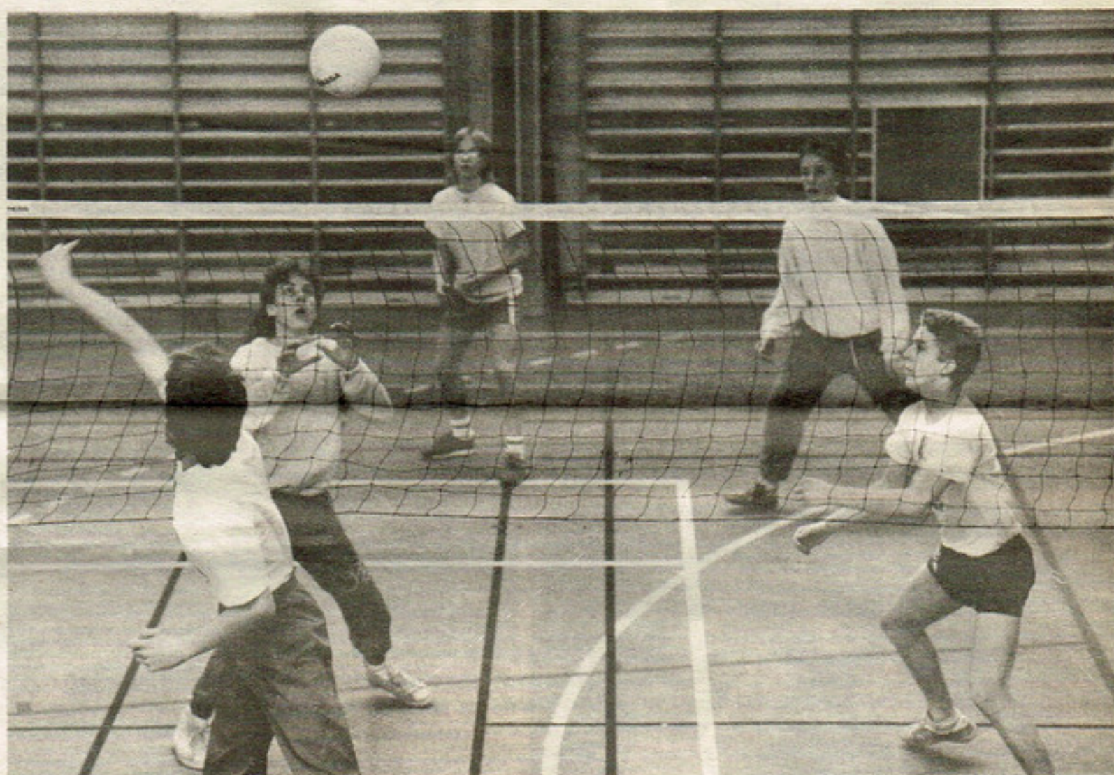
Den här bilden från "Gustav Grand Prix" i volleyboll är hämtad från matchen Södervärn klass 9 F och Solberga klass 8 E. Matchen slutade oavgjort 1-1.

I april anordnas nästa ungdomstävling i volleyboll i samma stil som den igår. Då kanske lite fler skolor visar sitt intresse.