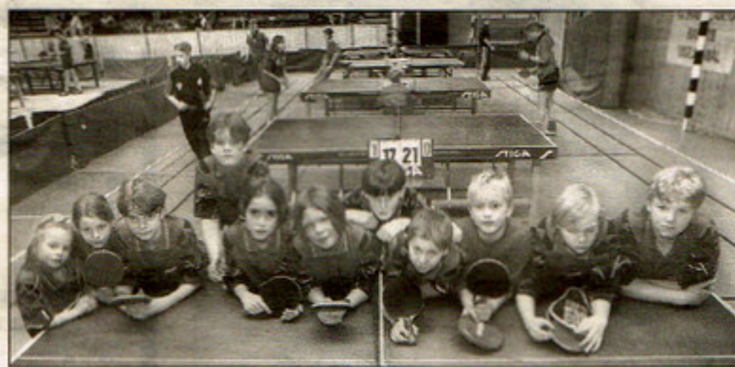
Här är några, inte alla, unga spelare i nya Stenkyrka BTK.