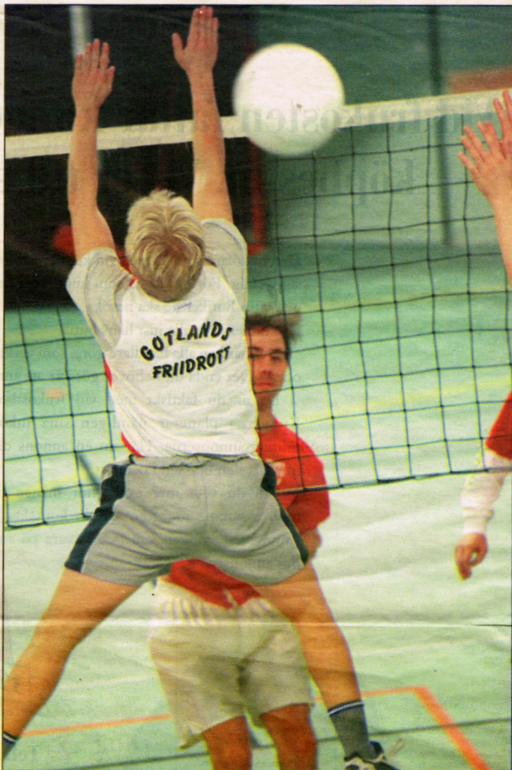
Bilden th: Smasch! Bollen från en Wall-spelare passerar förbi motsändarens block och ger poäng, som sen betyder matchvinst.