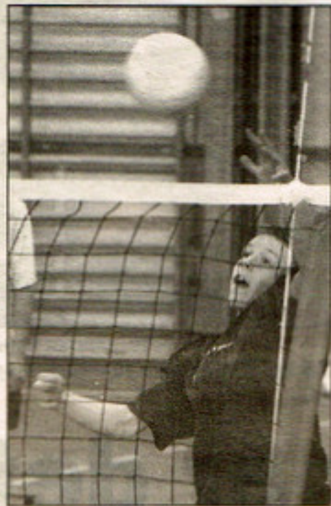
Killar fick också vara med.