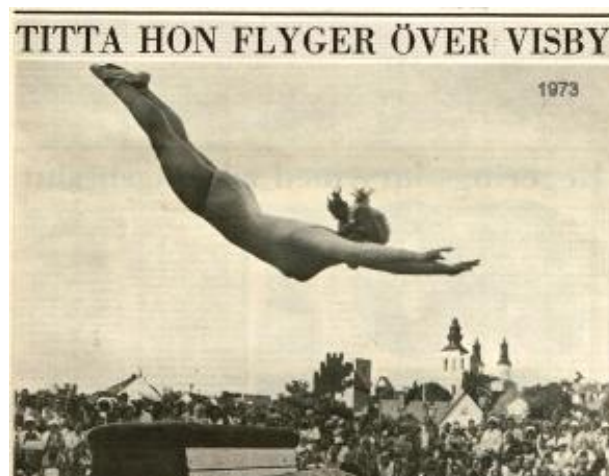
Ett par tusen gotlänningar och sommargäster satt i gräset och häpnade. Över plinten och stan flög Sofia-flickorna. År 1973