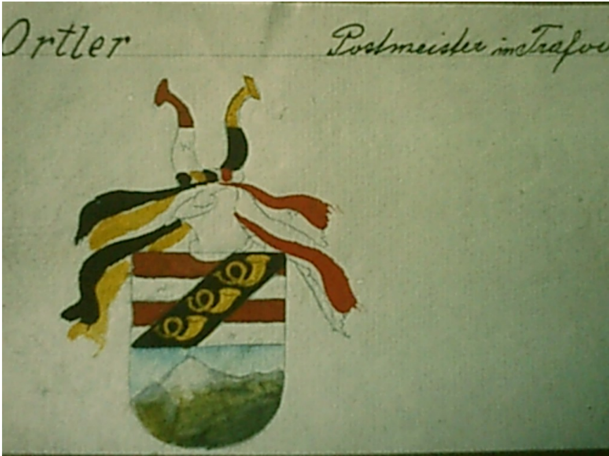
Ortlers familjevapen med berget Ortler och ovanpå tre posthorn och en cylinderhatt med plyschfanor runtomkring som symboliserade Postmästarens klädsel och status.