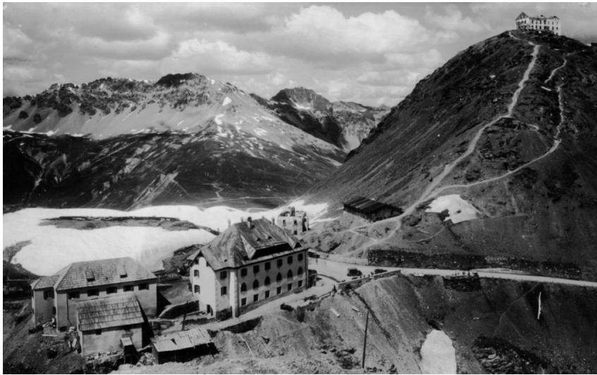
Stilfserjoch eller Passo dello Stelvio ligger i Ortler Alpena i Italien mellan Stilfs i Südtirol och Bormio i provinsen Sondrio. Passet ligger ca 75 km från Bolzano och ca 200m från till Schweiz.