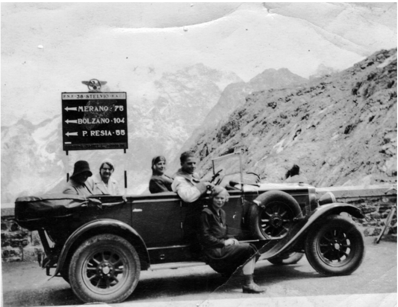
Här sitter mamma på fotbrädet på en gammal bil och har två tredjedelar av livet framför sig.....