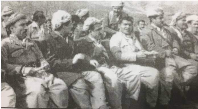
صورة للمؤلف في ١٩٧٣/٣/٣٠

ماوهیه ک که له ئێران رایکرد له سوریا ژیا پاشان چووہ میسر و لهویش دەستبەسەرکرا ، له ریگای