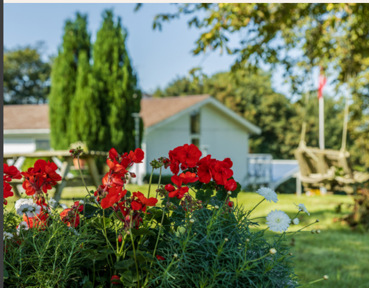
Opholdsstedet FYRET bliver drevet som en almenvælgørende fond.

OPHOLDSSTEDET FYRET Søvejen 82, Vitved Stilling 8660 Skanderborg