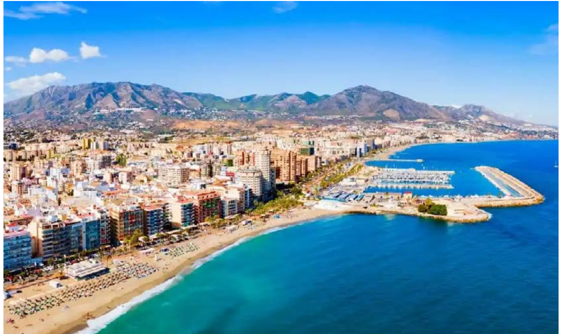
Fuengirolan sataman ympäristö on Andalusian kolmanneksi kalleinta aluetta asunon vuokraamisessa.

mat vuokraneliöt löytyvät odotetusti Madridista ja Barcelonasta.