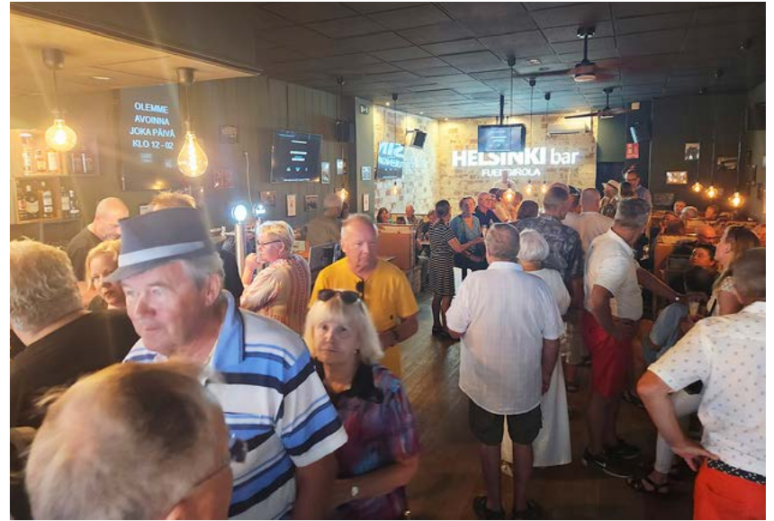
Costan Tähti -karaokekilpailu huipentuu torstaina 21.3.