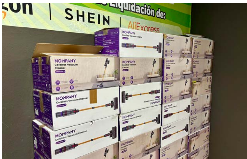
Langaton varsi-imuri 10 eurolla? Tästä niitä saa.

Uutuutena on Muoti-tiistai. Silloin tarjotaan 5 euron Sheinin vaatteita sekä jatkoksa myös Inditex-konsernin (kuten Bershka ja Zara) palautettuja vaatteita.