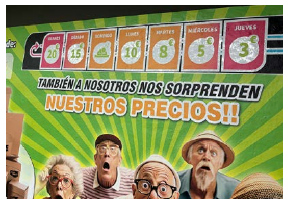
Tuote maksaa perjantaina 20 euroa, ja sen hinta laskee päivittäin. Jos sitä on vielä seuraavana torstaina jäljellä, hinta on silloin vain kolme euroa.