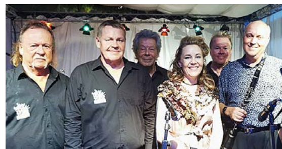
Seita & Friends on maanantaina gospeluulella ja keskiviikkona leffamoodissa.