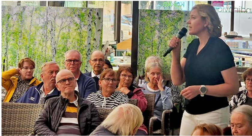
Henna Virkkunen tapasi innokkaita poliitikasta kiinnostuneita Aurinkorannikon suomalaisia viikko sitten.

kossa. Molempiin osallistui runsaasti väkeä, Kukon sali oli käytännössä täynnä