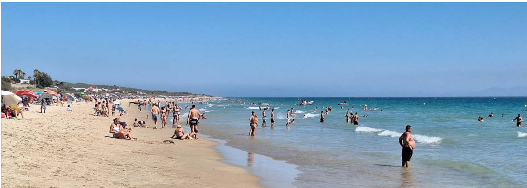
Rantaelämää koskevia lakeja on hieman täsmennetty, turvallisuuden ja viihtyvyyden lisäämiseksi.