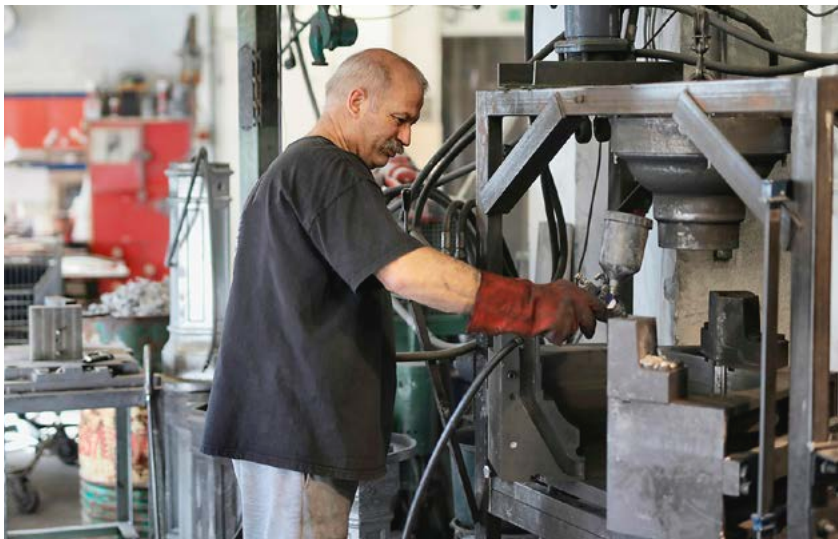
Espanjassa jatketaan työuria, jotta eläke olisi hieman parempi.

Vuonna 2012 Málagan alueella työelämässä oli mukana 29.150 henkilöä, jotka olivat 60-vuotiaita tai vanhempia. Nyt vastaava