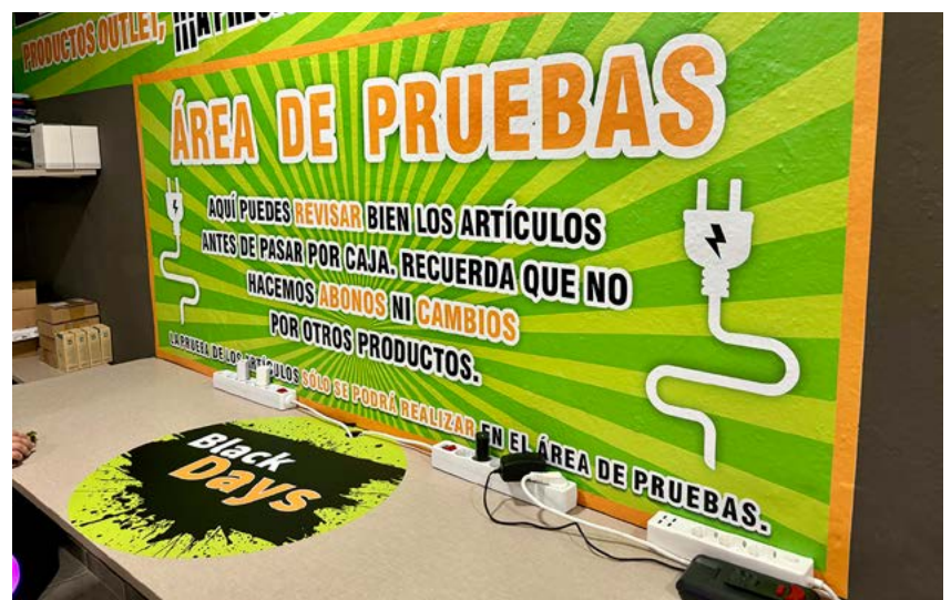
Vaikkapa imuria tai hiustenkuivaajaa saa testata ennen ostoa, jotta voi varmistua tuotteen toimivuudesta.