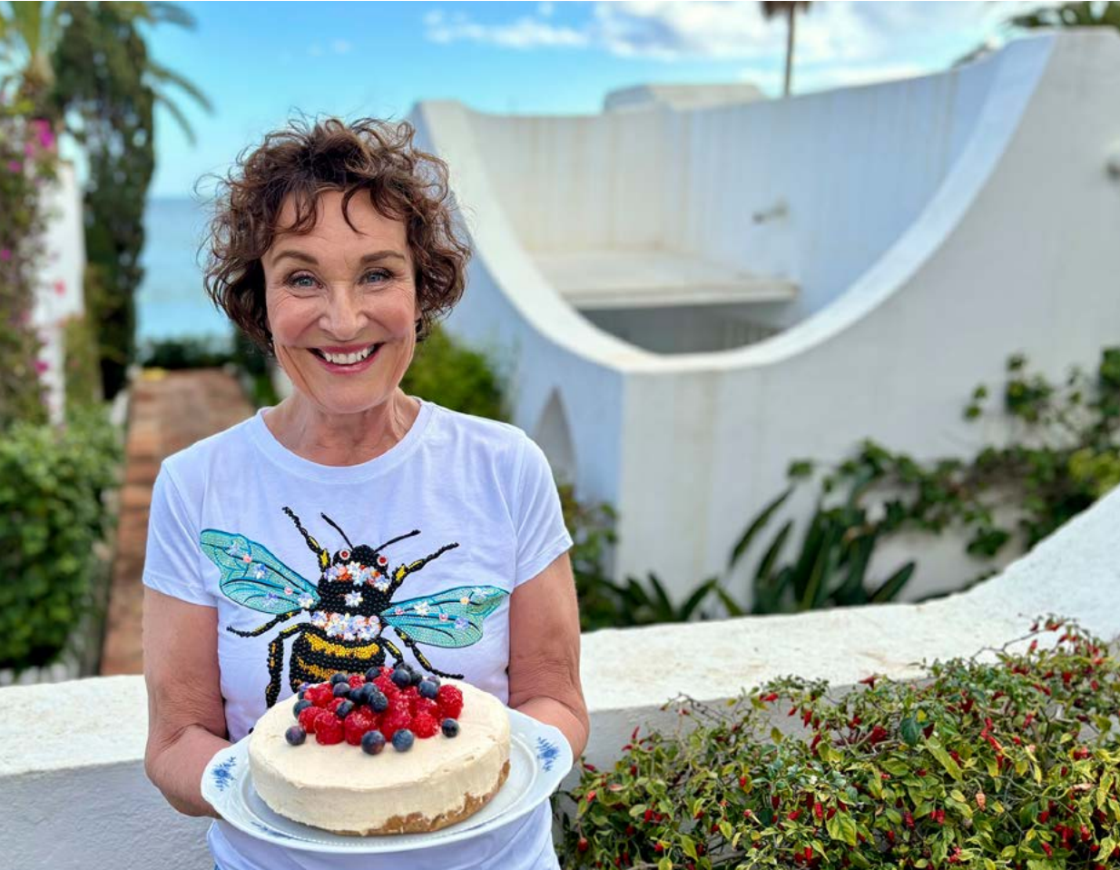
kodissaan. Ruskehtava väri tulee taatelisokerista. Takana vellova meri on tärkeä elementti.