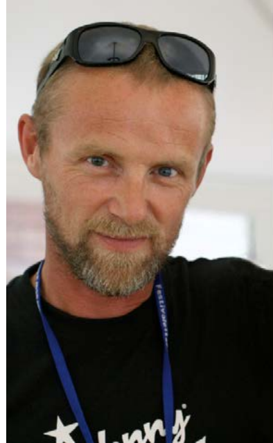
Jo Nesbø viihtyy Málagaan kaupungissa Espanjan Aurinkorannikolla.

– Ei. Luulen, että elämäni olisi erittäin huono romaani, erittäin tylsä romaani. Jotta mikä tahansa tarina toimisi, tarvitaan valtava konflikti. Kaikki suuret tarinat käsittelevät suuria menetyksiä. Sitä me etsimme tarinoista: kärsimystä ja menetystä. Ja pelkään, että sitä on hyvin vähän elämässäni.