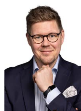
Suurimman oppositiopuolueen SDP:n puheenjohtaja Antti Lindtman antaa ajankohtaisen katsauksen kotimaanpolitiikkaan.