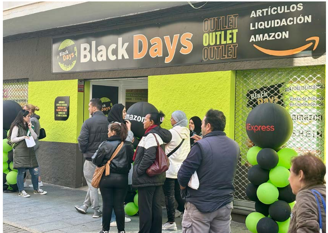
Black Days Outlet -liike avautui San Pedro de Alcántaran keskustaan maaliskuun alussa. Jonot ovat joka-aamuksia täälläkin, kuten ketjun muissa liikkeissä Andalusiaassa ja Aurinkorannikolla.

Ainoa ero Amazonin verkkovalikoimiin verrattuna on hinta. Kun tuote verkkokaupassa maksaa 500 tai vaikkapa 1 500 euroa, Black Days -outletista sen voi saada 20 eurolla tai