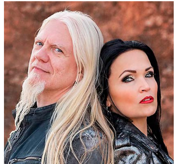
Tarja Turunen ja Marko Hietala ovat Nightwishin perustajajäsenet. Syyskuussa he esiintyvät yhdessä Fuengirolassa.

Tarja Turunen ja Marko Hietala ovat kansainvälisesti arvostettuja muusikoita heavy-piireissä. Nightwish on menestynyt mainiosti espanjankielisissä maissa, erityisesti Etelä-Amerikassa. Myös Turusen sooloura on ollut hyvässä nosteessa. Espanjasta löytyy paljon fa-