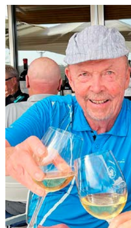
Skål hienolle suoritukselle.

– Kun tulee ikää lisää, se tarkoittaa useampia harjoitteluvuolia. Pitäähän harjoittelun näkyä tuloksissa ja