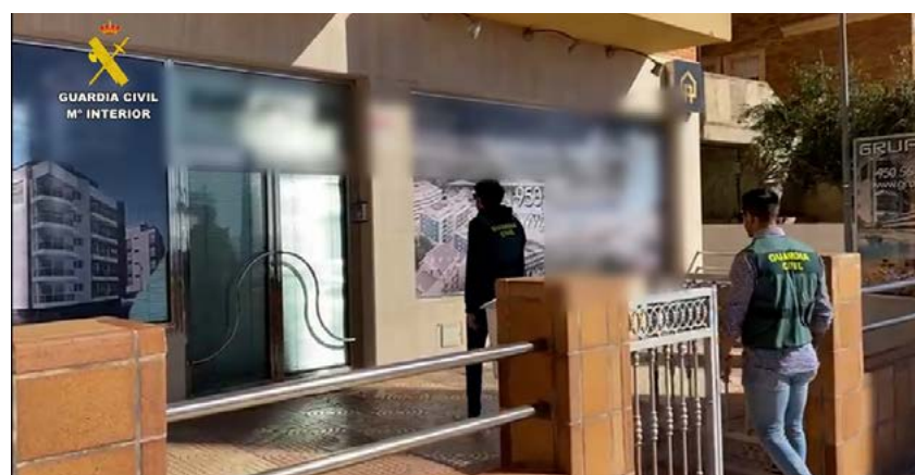
Guardia Civil iski helmikuun alussa Grupo 21 -kiinteistönvälitysfirman toimistoihin Andalusiassa ja Murciaassa. Kuvakaappaus Guardia Civilin videosta.

21 markkinoi ja kauppassi 800-1 000 asuntoa tonteilla, joita he eivät koskaan omistaneet.