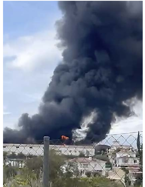
Massiivinen savupatsas näkyi palopaikalta kauas.

Palokunta sai lopulta palon hallintaan melko nopeasti, eikä palossa aiheutunut henkilövahinkoja. Lähialueen asukkaita evakuoitiin varmuuden vuoksi, koska palosta nousi myrkyllistä savua. Asukkaat pääsivät takaisin koteihinsa kun palo oli taltutettu.