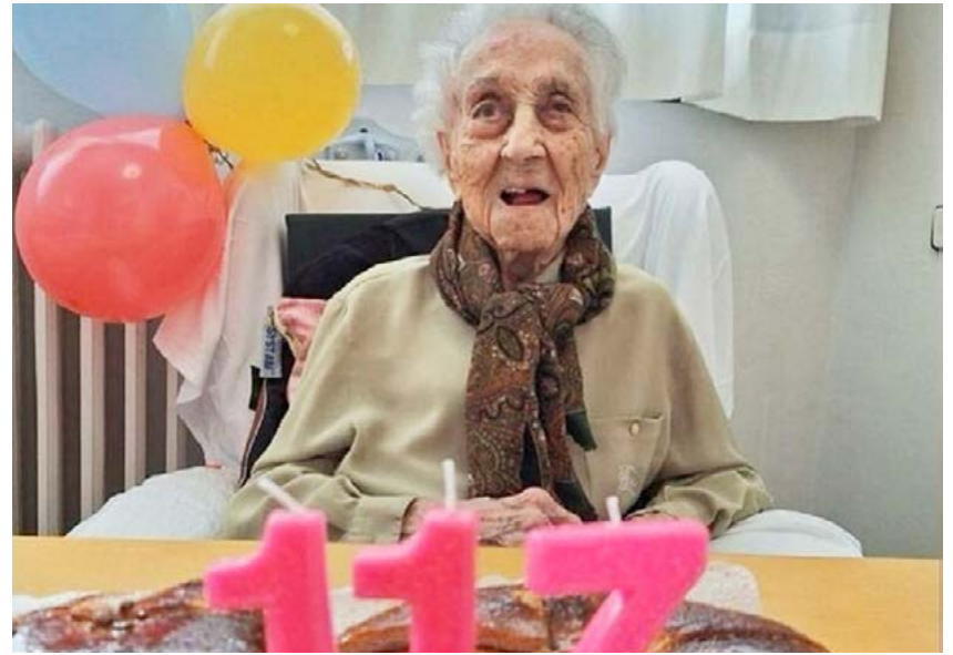
Espanjan ja maailman vanhin ihminen María Brnyas täytti 117 vuotta maanantaina 4.3.2024.