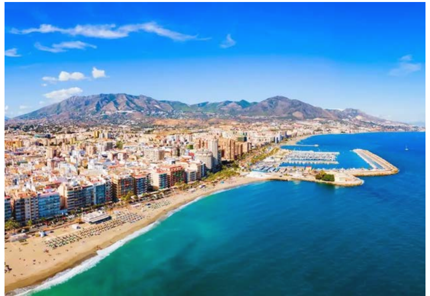
Aurinkoa ja lämpöä riittää koko kevääksi Fuengirolan seudulle Espanjan ilmatieteen laitoksen ennusteen mukaan.

Aemetin ennusteen mukaan Espanjan Atlantin puoleisella rannikolla sen sijaan on luvassa kostea kevät, ja korkeita sademääriä odotetaan Galiciassa, Kastilia ja Leónissa, Extremadurassa sekä myös Andalusian Huelvan maakunnassa.