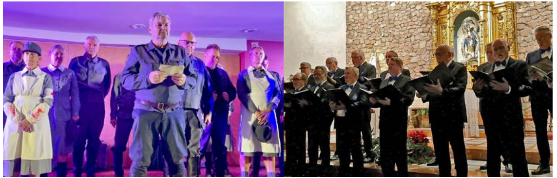
Teatteri Suomelan Tuntematon sotilas ja Örisevät-kuoro nähdään Floridassa ensi joulukuussa.