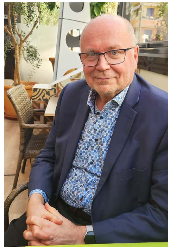
Eero Heinäluoma pyrkii toiselle kaudelle EU-parlamenttiin.

– Olen ihmisenä sellainen, että pyrin hoitamaan päällä olevat tehtävät mahdollisimman hyvin. En kovin paljoa mieti omaa tulevaisuuttani. Olen onnellinen siitä, että terveys on säilynyt hyvänä ja tuntuu siltä, että virtaa riittää vielä