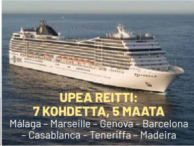
UPEA REITTI: 7 KOHDETTA, 5 MAATA Málaga – Marseille – Genova – Barcelona – Casablanca – Teneriffa – Madeira