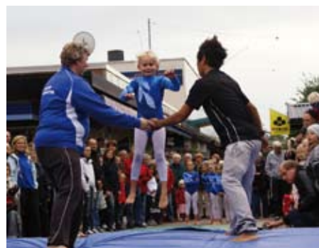
IFK-dagen på gågatan.