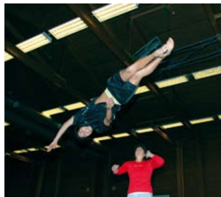
Vid trupp gymnasternas julshow.