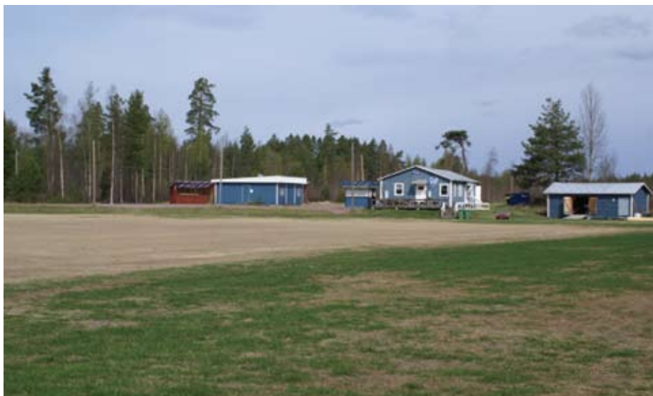
Fotbollsplanen på Wasaliden våren -08.

Vi fotbollsälskare måste enas, samlas och sluta upp för fotbollen i Mora. Fotboll är ett fantastiskt spel och nog förtjänar fotbollen i Mora kommun något bättre än det här!