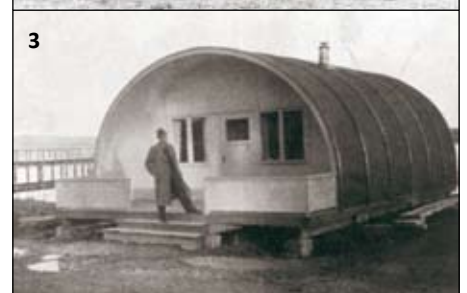
1. Snöig aprilkväll 1984, Evergreen Cup i fotboll. 2. IFK Moras årsmöte i N Garberg. 3. IFK:s klubblokal Valvbåghuset 1944-47