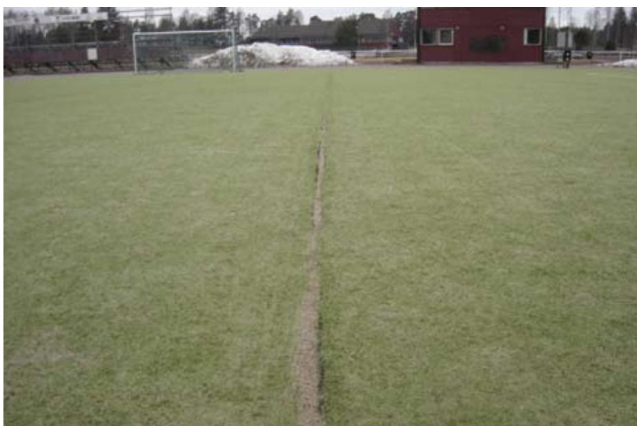
Konstgräsplanen på Prästholmen våren -09.