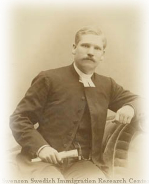
Swenson Swedish Immigration Research Center