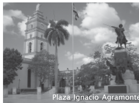
Plaza Ignacio Agramonte

Verder wandelend langs het theater (waar geregeld opvoeringen kunnen gezien worden van het tweede belangrijkste ballet-ensemble van Cuba, na het nationaal ballet van Havana) komen we uiteindelijk op het centrale plein uit, Plaza Ignacio Agramonte (het oorspronkelijke Wapenplein, "Plaza de Armas", van de Spanjaarden). In het midden van dit plein staat een bronzen ruitersstandbeeld dat alweer de lokale held herdenkt, rondom staan 4 koningspalmen die de onafhankelijkheidsstrijder Joaquín de Agüero en zijn companen herdenken, mannen die naar aanleiding van een opstand tegen de koloniale in 1851 door de Spanjaarden werden gefusilleerd op dit plein. Verder op het plein bevindt zich ook de statige kathedraal en Camagüey's Casa de la Trova. Hier kunnen lokale groepjes en muzikanten hun kunsten aan het publiek laten horen.