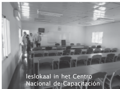
leslokaal in het Centro Nacional de Capacitación