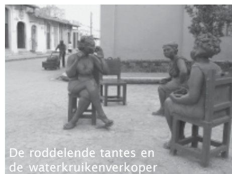
De roddelende tantes en de waterkruikenverkoper

De wandeling doorheen het historische centrum kan worden afgerond op de Plaza del Carmen, op een boogscheut van de Plaza San Juan de Dios. Recent gerestaureerd nodigt dit pleintje en het aanpalende straatje uit tot slenteren, keuvelen, een kijkje te nemen in de verschillende kunstgallerijtjes. Leuk detail: een lokale kunstenaar maakte een aantal jaren geleden een keramie-