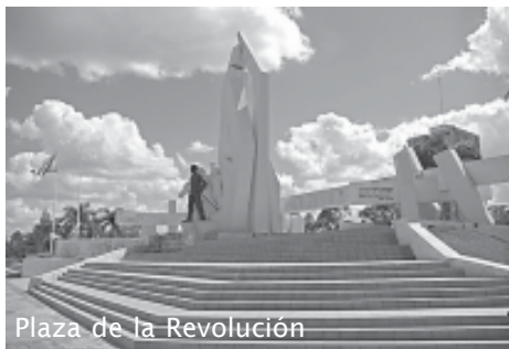
Plaza de la Revolución

De stad kent qua oppervlakte het grootste historische centrum van het land en een wandelende verkenning van het historische Camagüey is dan ook zeker de moeite waard. Gezien de afstand tussen Camagüey en de meeste grote trekpleisters van Cuba laten veel Cuba-bezoekers de stad echter links liggen, wat haar des te aantrekkelijker maakt voor wie er wel komt.