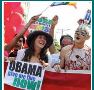
» Mariela Castro p15