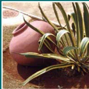
» Camaguey p12