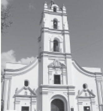
Iglesia de nuestra señora de la Merced