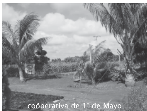
coöperativa de 1° de Mayo