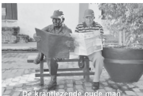
De krantlezende oude man

van San Juan de Dios gebracht. Aan de overzijde van het plein hangt aan een gevel de tekst van het liedje "Al Mayor" van Silvio Rodríguez, geschreven en gebracht ter gelegenheid van de 100 ste verjaardag van de dood van Agramonte (1973). Culinaire lekkerbekken moeten op dit pleintje in Camagüey zeker langs bij het restaurant La Campana de Toledo, waar ze de lokale specialiteit "boliche" serveren. Een aanrader.