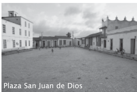
Plaza San Juan de Dios

We houden de Casa de la Trova aan onze rechterkant en wandelen verder de bochtige straat naar beneden in – links en rechts staan verschillende mooie koloniale façades – om zo uiteindelijk via een aantal kleine, kleurrijke straatjes uit te komen op de Plaza de San Juan de Dios, misschien wel het meest pittoreske pleintje van de stad. Dit is als het ware een decor voor een historische film. De kerk van San Juan de Dios priemt boven het pleintje uit met haar kleine klokkentoren; houten balustrades, een geplaveid wegdek, kleurige gevels en pannen daken helpen allemaal mee in het scheppen van een uiterst koloniale sfeer. In de kerk en het aanpalende voormalige hospitaal werd ooit het lichaam van de gesneuvelde Agramonte opgebaard en geïdentificeerd. De man was op het slagveld gesneuveld en de Spanjaarden hadden zijn lichaam gerecupereerd en naar het hospitaal