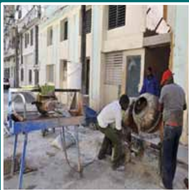
» actua p5