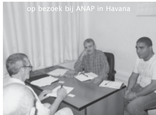
op bezoek bij ANAP in Havana

Dit jaar steunt VVC/Kempen een ander project van FOS: bijscholing en vorming van kaders van ANAP (Asociación Nacional de Pequeños Productores, – de Nationale Vereniging van Kleine Boeren). In 2008 werd begonnen met een 6-jarenprogramma van ANAP waar de eerste 3 jaar vooral aandacht besteed werd aan de vorming en opleiding van kaders en promotoren in de meer dan 3.600 lokale landbouwcoöperaties in 166 gemeentes. Vanaf 2011 is het tweede deel van het FOS-project gestart, waarin de klemtoon verlegd werd naar de vorming van het eigen kader van ANAP.