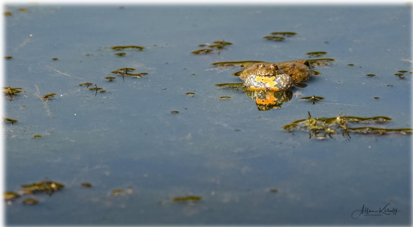
Klokkefrø med sin flot udspilede kvækkepose.

hvorefter det tørt lød - "årrr 999 kan gøre det ☺