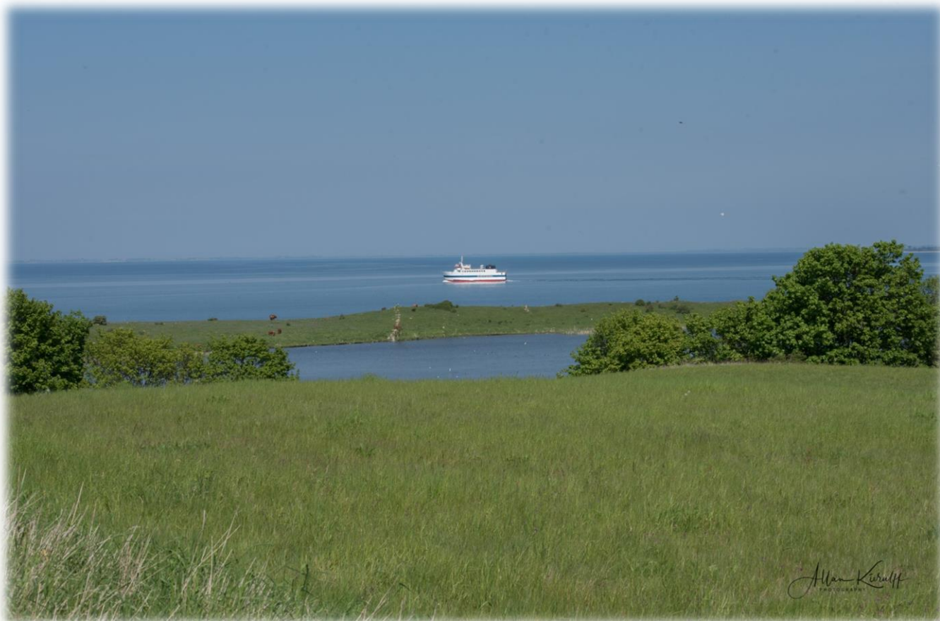
Sejerø færgeren set fra Nekselø