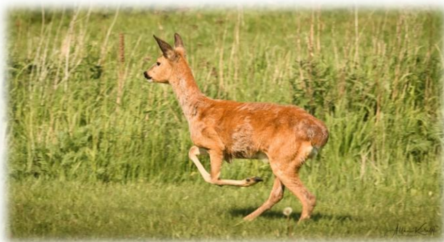
Et ungt rådyr på vej væk fra en gruppe fotografer.