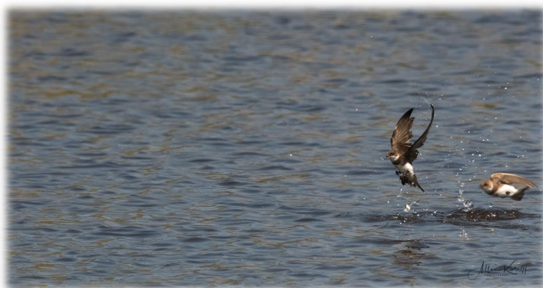
Digesvaler henter føde til ungerne.