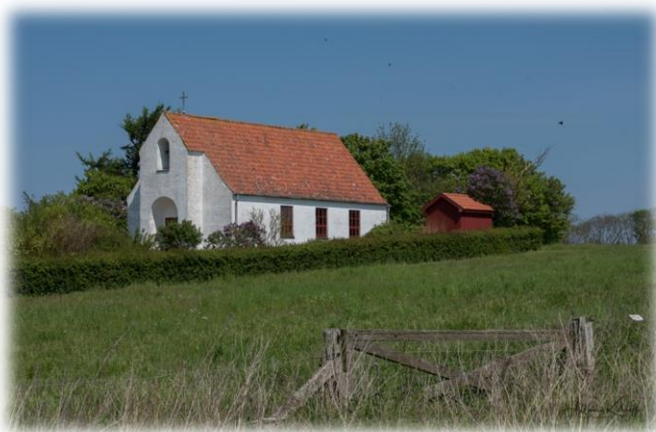
Kirkebygningen (opført i 1931 er smukt beliggende