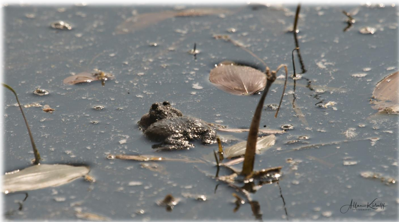
En klokkefrø set fra oven – her ser den ikke så spændende ud.