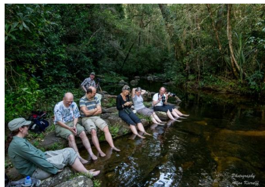
Tærerne afkøles og pilles

Mine fødder var nu ikke i vandet, så jeg fik mig en snak med vores lokale guide, som viste mig, at vi nu skulle over floden lidt længere nede. Det skulle foregå først ved at ballancere på en lille smalle og glat stenkant lidt over og langs vandet. ” Kilppekanten ” gik hen til en ”overgang” over floden, som altså lige var et hop fra en glat bred til våde sten og videre til en lige så glat bred – lige noget for mit ganske upålidelige og ”lumske” venstre ben. Et svigt fra det var lige med en tur i baljen med begge kameraer, linser og meget andet godt grej – slut på fotografering, slut på fotosafari, som allerede på dag to pludselig ville blive til en ganske almindelig ”kikke-kikke safari” = ikke så interessant for en ”fotograf”.