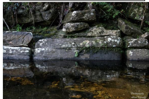
Noget af den smalle farlige klippekant