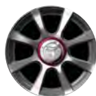
16" LEICHTMETALLFELGEN MIT 8 SPEICHEN UND BEREIFUNG 195/45 R16