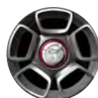
OPTIONAL 17" LEICHTMETALLFELGEN MIT 5-LOCH-DESIGN, MIT BEREIFUNG 205/40 R17