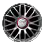
OPTIONAL 17" LEICHTMETALLFELGEN MIT 10 SPEICHEN, MIT BEREIFUNG 205/40 R17