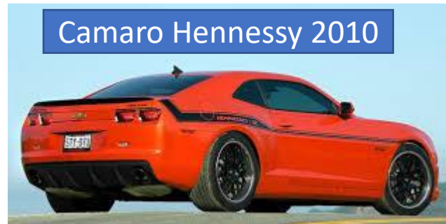
Camaro Hennessy 2010