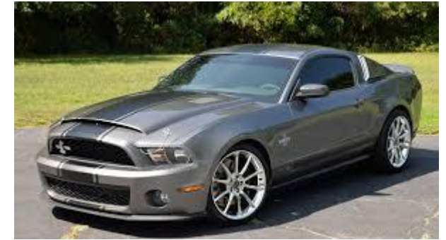
Shelby GT 500 Super Snake