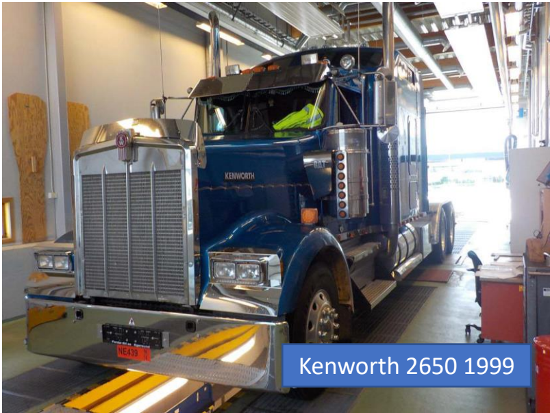
Kenworth 2650 1999