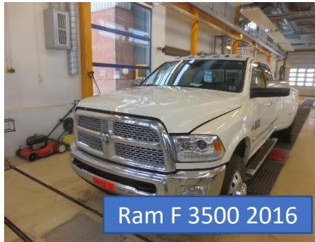
Ram F 3500 2016