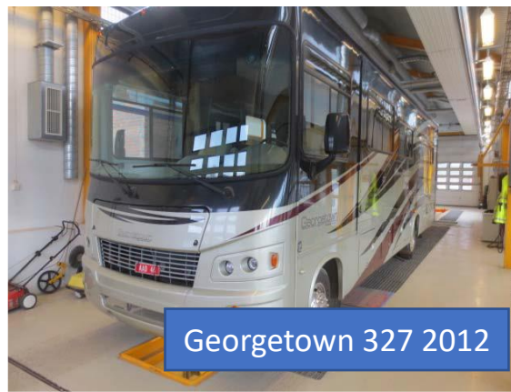
Georatown 327 2012