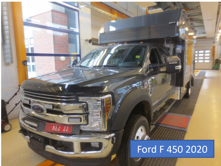
Ford F 450 2020