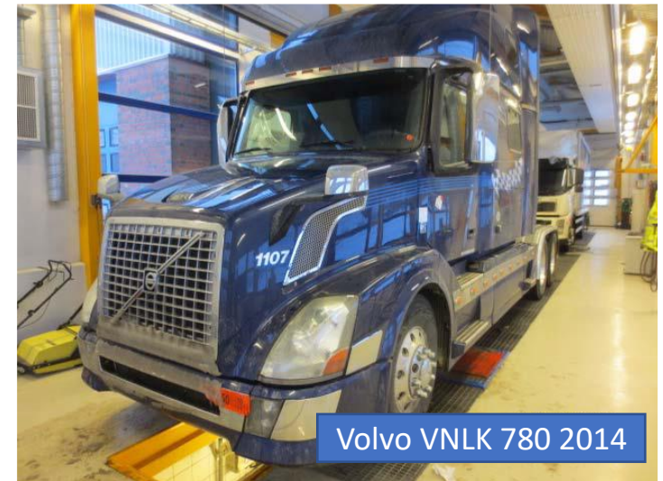
Volvo VNLK 780 2014