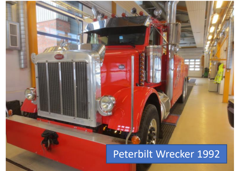
Peterbilt Wrecker 1992