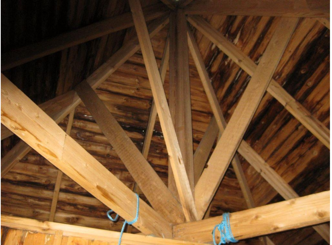
Taket viser råteskader innvendig, men bærekonstruksjonen skal være i god stand.

Tilbake til Færøytårnet, som pr. i dag ifølge søknaden har mye råte i tak og vegger. Byggmestre foreningen har hatt med på befaring har konkludert med at tak og vegger må skiftes, mens reisverket er nesten intakt.