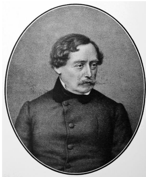
Christian Winther 1796-1876